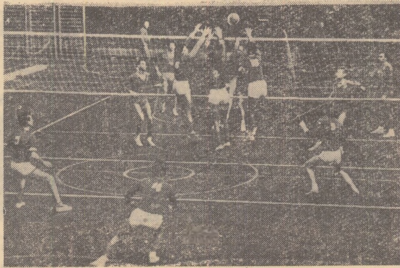
Fază din meciul Cetatea Bucur — Politehnica Or. Stalin

Categ. A masculin: Știința Timișoara-Dinamo București 2-3 (15-13, 9-15, 15-7, 7-15, 3-15), Utilajul Petroșani-Stiința Cluj 1-3 (13-5, 15-10, 10-15, 6-15), Tractorul Orașul Stalin-C.C.A. 3-0 (7, 11, 10), Cetatea Bucur-Politehnica Or. Stalin 3-0 (8, 3, 4), Rapid-Stiința Galați 3-0 (0, 13, 5), Victoria-Constructorul 3-0 (9, 6, 13); Categoria A feminin: Voința Sibiu-Progresul Tîrgoviște 5-0 (13, 9, 8), Metalul MIG-Dinamo 1-3 (12-15, 15-12, 10-15, 5-15), C.P.B.-Rapid 1-3 (12-15, 15-13, 9-15, 9-15), Progresul Buc.-Voința Or. Stalin 1-3 (12-15, 4-15, 15-13, 13-15), Știința Cluj-Petrolul Constanța 3-1 (15-12, 15-13, 9-15, 15-12), Someșul Cluj-Stiința Timișoara 3-0 (1, 5, 8); Categoria B: seria 1 - A.S.A. Marina Constanța-C.S.M.S. Iași 2-3 (15-7, 10-15, 20-22, 15-9, 12-15), Voința Buc.-Știința Buc. 2-3 (4-15, 15-11, 4-15, 15-5, 9-15), Feroviarul Constanța-Voința Suceava 3-1 (12-15, 15-7, 15-7, 15-6), Petrolul Ploiești-Voința Bacău 3-0 (11, 4, 1); Seria a II-a: Soimii Oraș Dr. P. Groza-C. S. Rm. Vlcea 3-1 (15-2, 17-15, 10-15, 15-6), I. C. Arad-Dinamo Oradea 3-2 (10-15, 15-9, 15-9, 8-15, 15-8); Dinamo Tg. Mureș-C.S. Craiova 3-2 (14-16, 15-11, 15-15, 15-12, 15-11), C.S.M. Baia Mare-Voința Sibiu 3-0 (12, 13, 12).