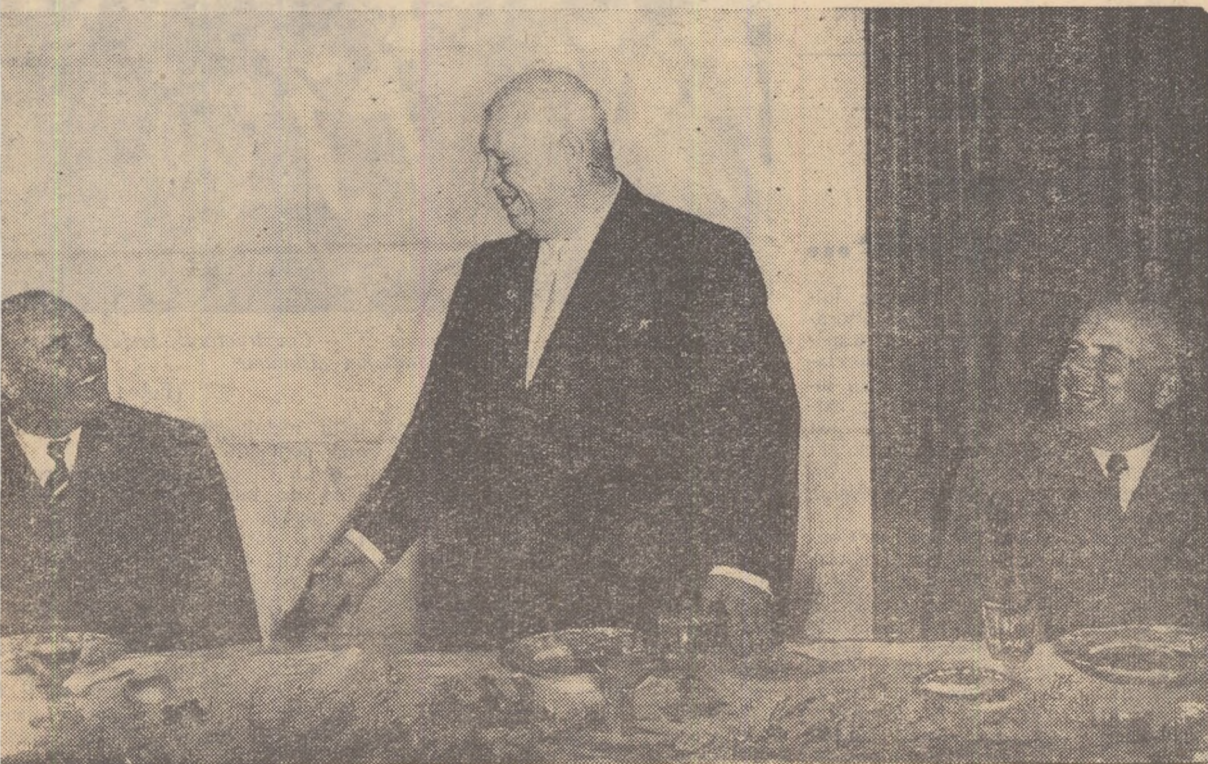
În timpul mesei date în cinstea tovarășului N. S. Hrușciov

25 octombrie 1959 de pe bordul avionului „IL-18”