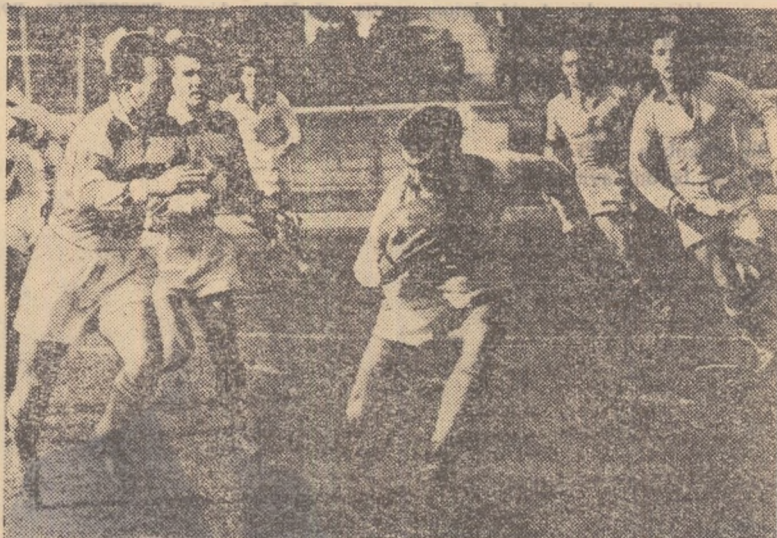
Fază din întîlnirea de rugbi Dinamo — Constructorul, desfășurată ieri mineată pe stadionul „Dinamo”