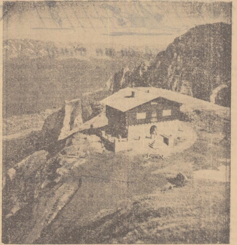
Cît de frumoasă este patria noastră! Splendida așezare a cabanei Caraiman, luminată din plin de razele soarelui, te îmbie să pornești la drum, să te bucuri din toată inima de neasemuit de frumoasele așezări ale patriei.