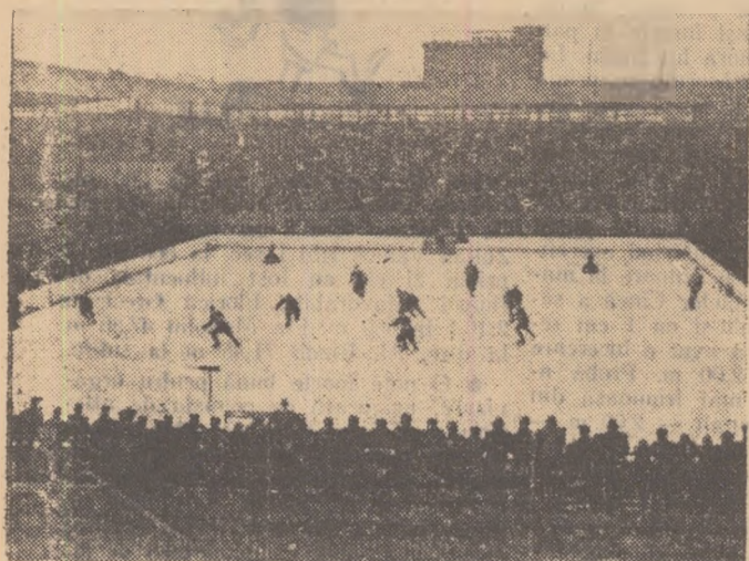
Stadionul de iarnă din Ostrava, unul din cele peste 30 de patinoare artificiale care există în R. Cehoslovacă.