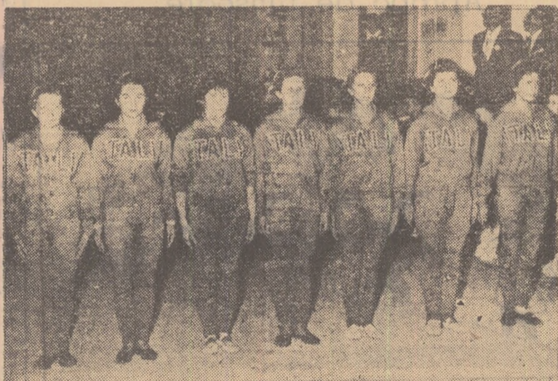
Echipa feminină de gimnastică a Italiei, adversara noastră de anul trecut de la Trieste.

Sportivele italiene sînt așteptate să sosească în Capitală în cursul zilei de astăzi. După concurs vor mai rămîie o săptămîină în București pentru a participa la antrenamente comune cu sportivele noastre. La înfiițarea de duminică va fi prezentă în calitate de arbitru și dna Berthe Villancher, președintele comisiei tehnice feminine din cadrul Federației Internaționale de Gimnastică.