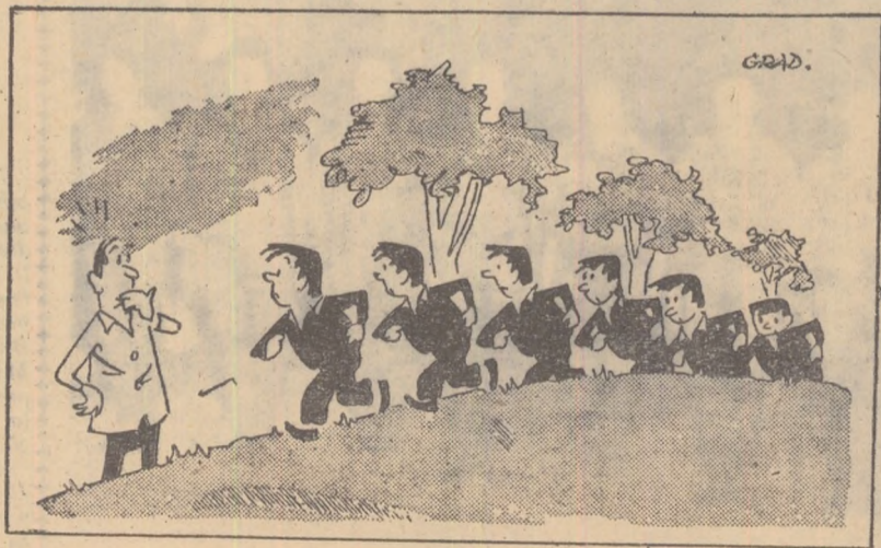
Antrenorul: — Echipa de fete n-a venit la antrenament? — Ba da! Noi sîntem!...