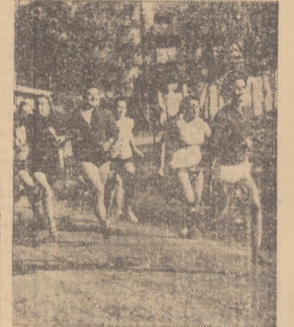
Tinerete sportive din raionul V. I. Lenin din Capitală în plină cursă!

Ne-au sosit vești din toată țara: de la Cluj și Slatina, Iași și Iluredoara, Săsar și Constanța. Peste