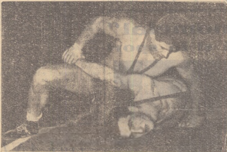
O fază din finala campionatului republican desfășurată ieri în sala Dinamo

Marina Constanța 16-0 și cu C.F.R. Timișoara 16-0. C.F.R. Timișoara cu Constructorul Cluj 11-3, cu A.S.A. Marina Constanța 8-8. A.S.A. Marina Constanța—Constructorul 15-1. C.C.A. —Baia Mare 12-2, cu Voința Tg. Mureș 8-6, cu Dinamo Satu Mare 10-2, Voința Tg. Mureș — Baia Mare 9-5, cu Dinamo Satu Mare 9-7, Dinamo