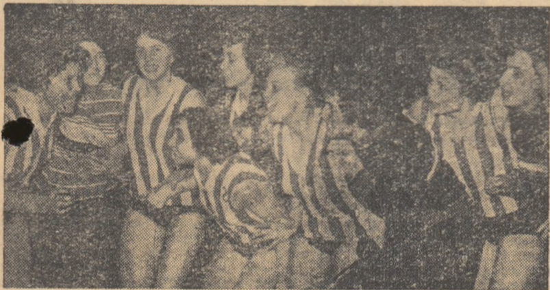
Cîteva clipe după ultimul set... Bucuria victoriei este oglindită pe fețele voleibalistelor romine care, jucînd excelent în decursul întregului turneu, au cucerit trofeul U.S.I.C.

Victoria a revenit reprezentantelor noastre cu 3-1 (16-14, 15-10, 13-15, 15-12). Performanță cu atât mai valoroasă cu cît este prima victorie a unei echipe feminine românești de volei asupra uneia sovietice.