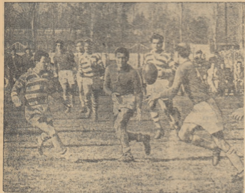
Chiriac (Progresul) lansîndu-și partenerul, dar apărarea studenților este la post

În „Parcul Copilului“, unde C.F.R. Grivița Roșie a înfîlșit Petrolul Ploiești, spectatori — în ciuda diferenței de scor — au asistat la o partidă plăcută. Au învins gazdele cu 32-3 (14-3). Feroviarul au jucat într-un ritm susținut de-a lungul întregii partide, vîndînd buna lor pregătire. Petroliștii, în schimb, au arătat lipsuri la capitolul pregătirii fizice și defecțiuni în tehnica individuală. Cei mai buni: Rusu, Wusek și Stănescu (C.F.R.) și Grădișteanu (autorul unei încercări) și Sabău de la Petrolul (N. B.)