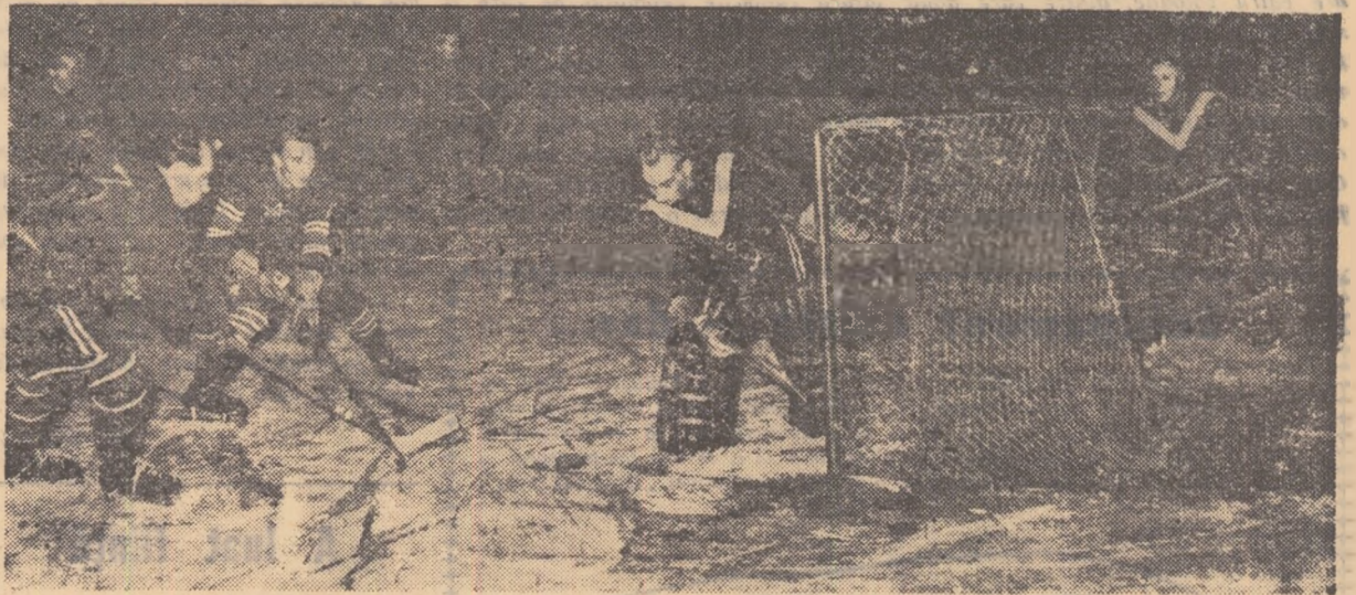
Fază din meciul C.C.A. - Avîntul. Portarul Sprencz II se pregătește să respingă pucul urmărit de Szabo și Ganga.