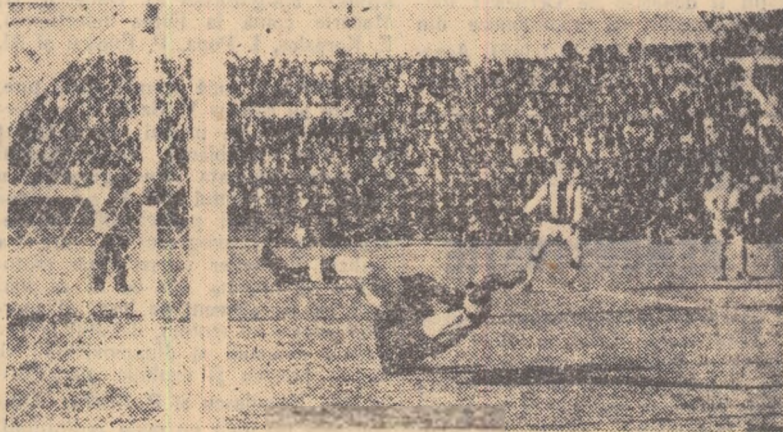
Șutul puternic al lui Babone nu a putut fi oprit de portarul clujean, astfel că mingea a intrat în gol.