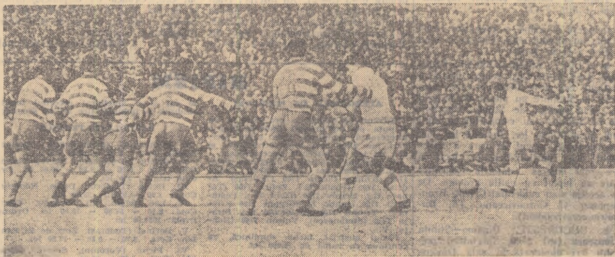
Louitura liberă din care U.T.A. a egalat în min. 88. Patschowski „aruncă” mingea peste „zid” cu multă precizie, surprinzând pe dinamoviști care se așteptau ca jucătorul arădean să tragă. (Citiți cronică meciului în pag. a 3-a)