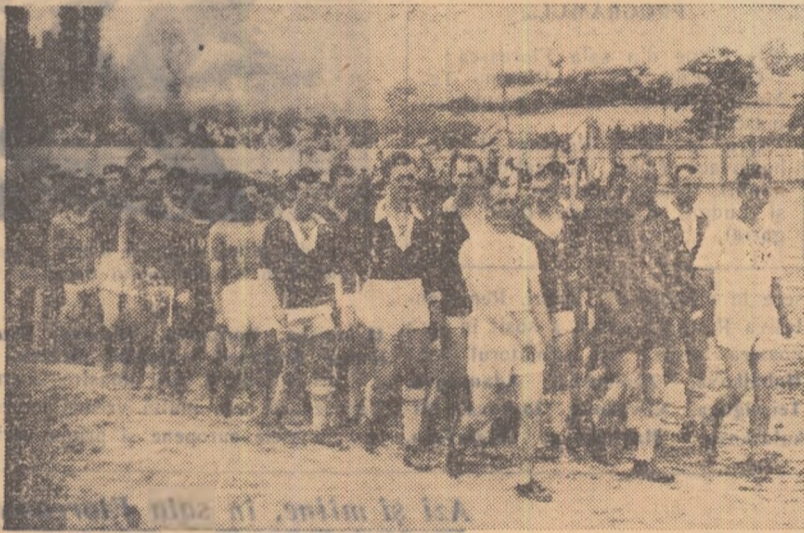
Peste cîteva minute va începe o pasionantă întrecere la care vor participa numărătoase echipe din raionul Istria (Babadag 1959)

O simplă privire asupra acestor cifre ne face să înțelegem perspectivele dezvoltării sportului sătesc în acest raion.