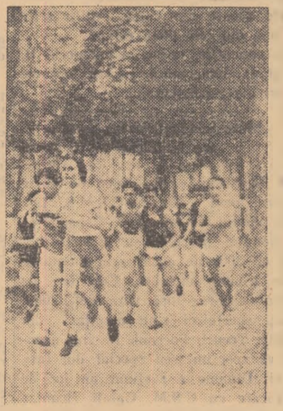
Aspect de la una din edițiile trecute ale competiției