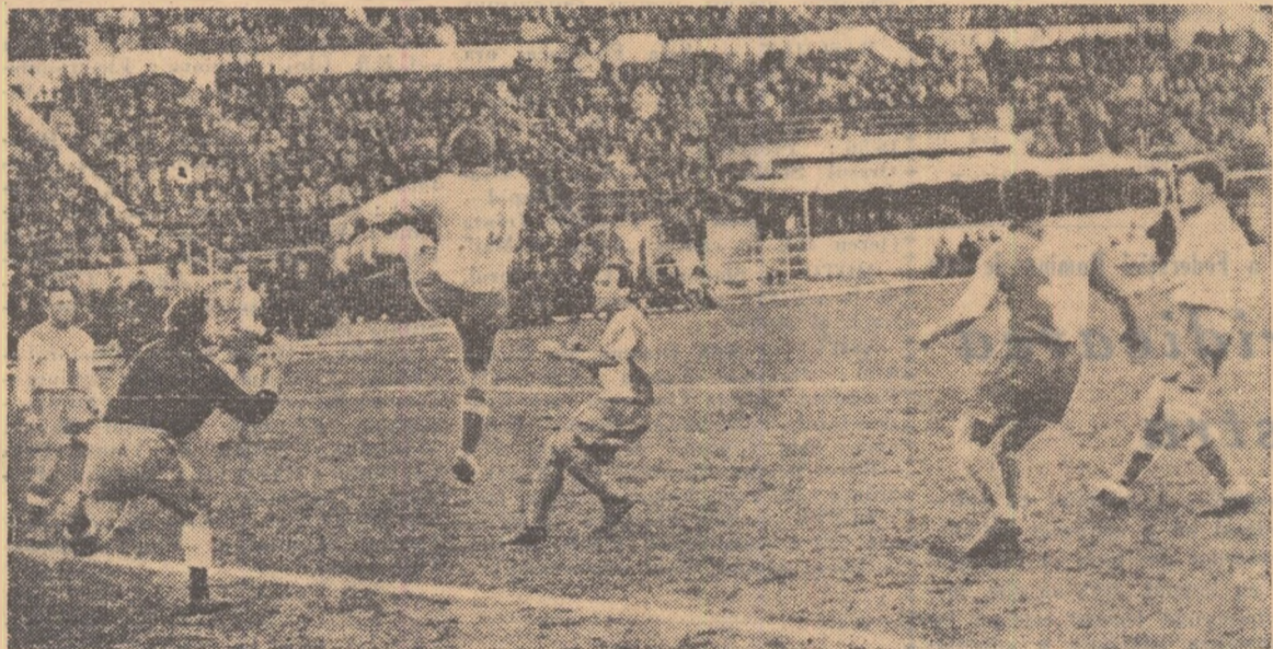
Ciuncan, stoperul echipei constănțene, respinge spectaculos un atac al Petrolului. Fază din meciul Petrolul—Farul (2—0)

reușit duminică trecută rezultatul de egalitate cu Știința Cluj. DINAMO BACĂU a învins joi echi-