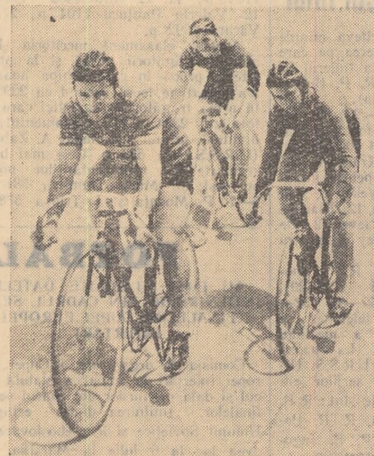
Sportivii din lotul olimpic de ciclism-pistă, în antrenament pe velodromul Dinamo.

unui eventual dublu fete, din aceste două concurențe. Dintre caiaciști, Mircea Anastasescu merge cel mai bine (2.00,5 pe 500 m.). Împreună cu el se mai pregătesc caiaciștii Teodorov, Ivanov, Sideri, Bardaș, în dublu sau pentru stafetă.