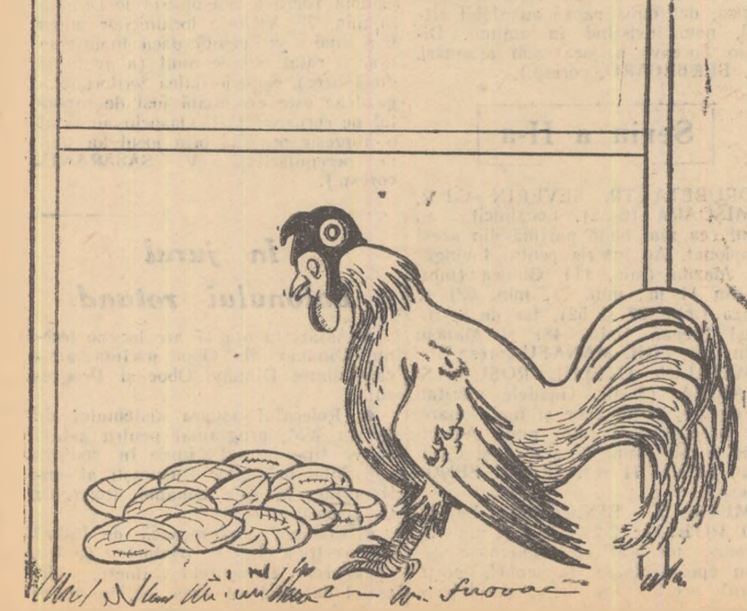
Ciudat! De mult nu s-a mai întimplat să fie atîtea ouă străine în ograda mea! Desen de S. NOVAC

Reprezentativa de rîgbi a R. P. Romîne a învins puternica formație a Franței (netînvisă de mult timp) cu 11-5