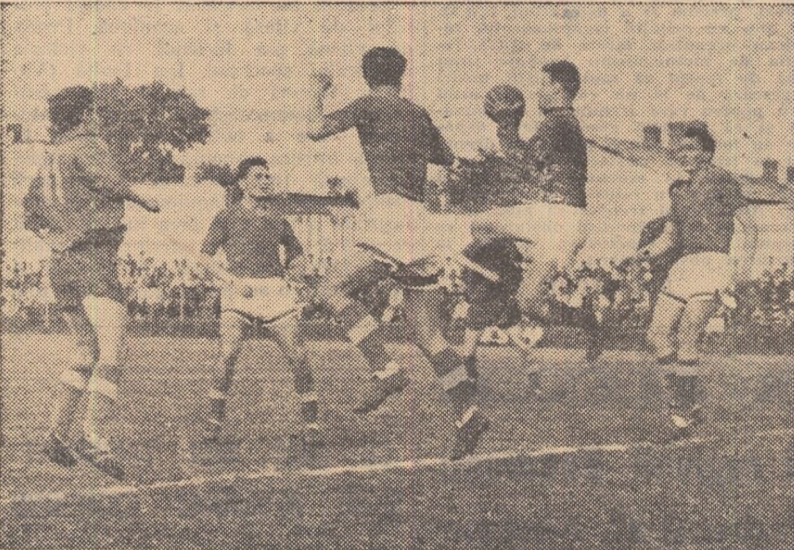
Portarul echipei oaspe intervine pentru a lămuri o fază critică. (Fază din meciul Metalul București — Dinamo Pitești 2—2)