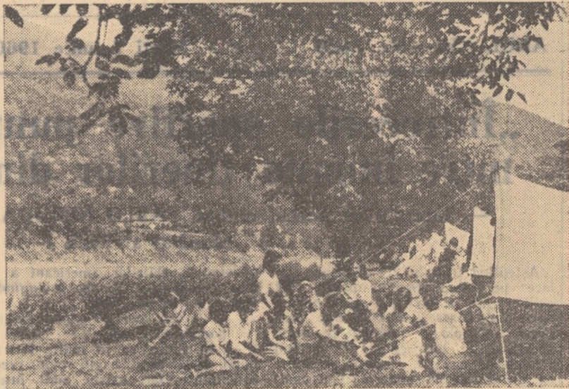
Minunate sînt clipele petrecute în mijlocul naturii. În ultimii ani, din ce în ce mai mulți oameni ai muncii participă la excursiile organizate de oficiile locale O.N.T., vizitînd cu acest prilej minunate colțuri ale naturii, noile construcții industriale sau monumente istorice

Trebuie să arătăm însă că nu numai în perioada primăverii a fost o afluență de turiști, ci chiar în timpul lunilor de iarnă. Astfel, putem da ca exemplu luna ianuarie, cînd 2500 de muncitori din Reșița și 2000 de muncitori și colectiviști din orașul și raionul Lugoj au vizitat orașul Timișoara,