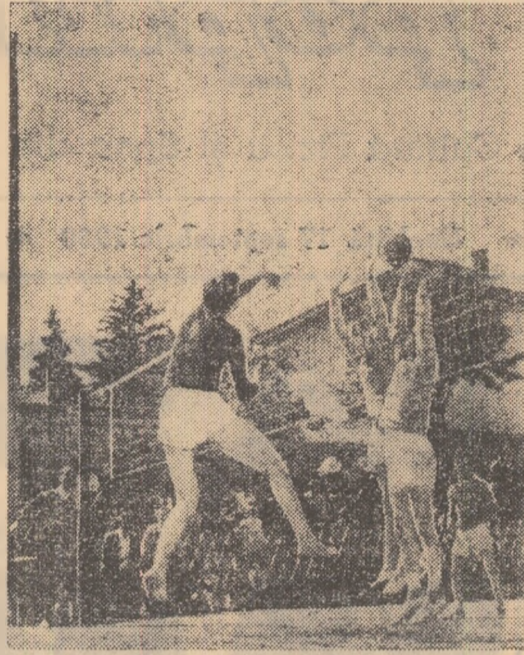
Fază din „Cupa Moldovei”. Se întrec echipele masculine de volei Recolta Dumbrăveni (raion Suceava) și Stevia Valea Sladului, același raion.