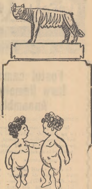
— Te sfătuesc să mergi cu mine la atletism, dacă vrei un spectacol minunat. Azi are loc săritura la înălțime femei!!!