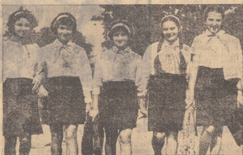
În prima zi de cursuri, elevii de pe întreg cuprinsul patriei au pășit în curtea școlilor îmbrăcați sărbătorește, cu buchete mari de flori pentru profesorii iubii.

Prima zi de școală a vestit un nou an de învățătură, de bucurii și emoții. Elevii au fost întâmpinați de clase curate și luminoase, de laboratoare bine utilitate și săli de sport. Au pășit în noul an școlar veseli, încrezători în viitorul lor luminos.