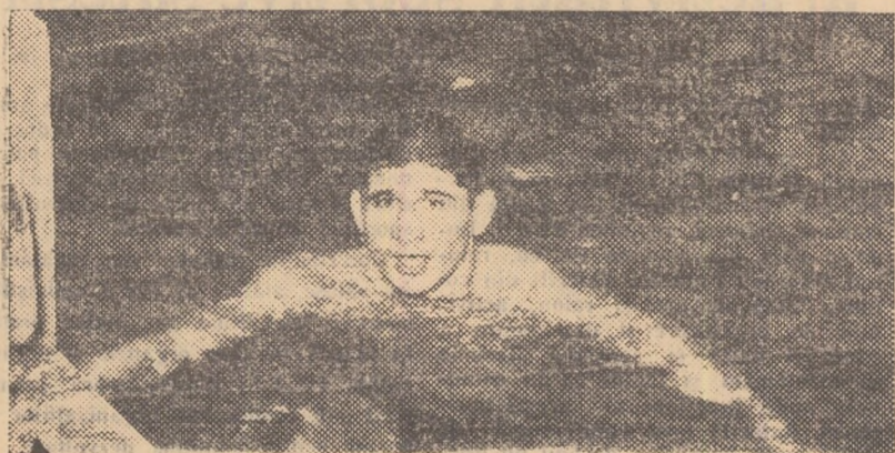
Campionatul tineretului Buc., campion republican în proba de 100 m. spate