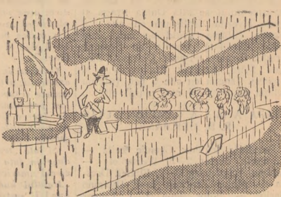
Desene de MATTY

FLOREA BUICA. CARAN. SEBEȘ. — 1) Echipa României n-a participat la campionatul mondial de fotbal desfășurat în 1950. În turneul final disputat în Brazilia s-au înregistrat următoarele rezultate: Brazilia-Mexic 4-0 (1-0), Anglia-Chile 2-0 (1-0), Suedia-Italia 3-2 (2-1), Iugoslavia-Elveția 3-0 (0-0), Spania-S.U.A. 3-1 (0-1), Brazilia-Elveția 2-2 (2-1), Spania-Chile 2-0 (2-0), Suedia-Paraguay 2-2 (2-0), S.U.A.-Anglia 1-0 (1-0), Iugoslavia-Mexic 4-1 (2-0), Brazilia-Iugoslavia 2-0 (1-0), Spania-Anglia 1-0 (1-0), Italia-Paraguay 2-0 (1-0), Chile-S.U.A. 5-2 (2-0), Elveția-Mexic 2-1 (2-0), Uruguay-Bolivia 8-0 (4-0). Finala s-a disputat, de asemenea, sub formă de turneu. Uruguay a cucerit campionatul mondial în baza următoarelor rezultate: Brazilia-Suedia 7-1 (3-0), Uruguay-Spania 2-2 (1-2), Brazilia-Spania 6-1 (3-0), Uruguay-Suedia 3-2 (1-2), Suedia-Spania 3-1 (2-0), Uruguay-Brazilia 2-1 (0-0). — 2) În 1954, România a luat parte la meciurile preliminare 3-1 (la București) și 2-1 (la Sofia) cu Bulgaria, 0-2 (la Praga) și 0-1 (la București) cu Cehoslovacia. Pentru turneul final din Elveția s-a calificat Cehoslovacia.