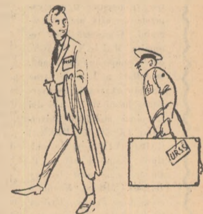
— Nu vă supărați?! Ce aveți în geamantan, de e așa greu? — Locul întii pe națiuni!!!