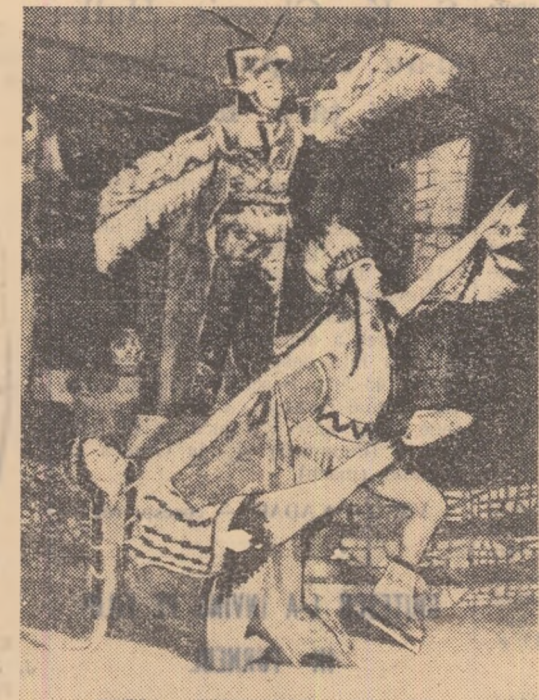
Această imagine nu poate reda, din păcate, bogăția de culori a costumelor din acest „tablou indian”, unul dintre cele mai reușite ale spectacolului Ansamblului maghiar pe gheață

se infiripă pretutindeni, și dintotdeauna, o vom vedea încolțind suav în inima neînțeleșului Charlot, co-