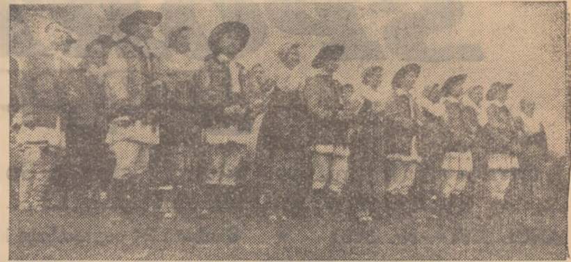
Îată în fotografie un grup de tineri danșatori pe care îi vezi în ziua duminică pe stadionul Republicii

După terminarea programului cultural-sportiv de pe stadionul Republicii, mai precis la orele 20,15 va avea loc jocul de fotbal în noaptea din cadrul categoriei A între echipele Dinamo București și Știința Timișoara. În pauza meciului de fotbal va avea loc o demonstrație de călărie — ștafetă pe un traseu cu obstacole la care vor participa echipe de juniori și seniori.