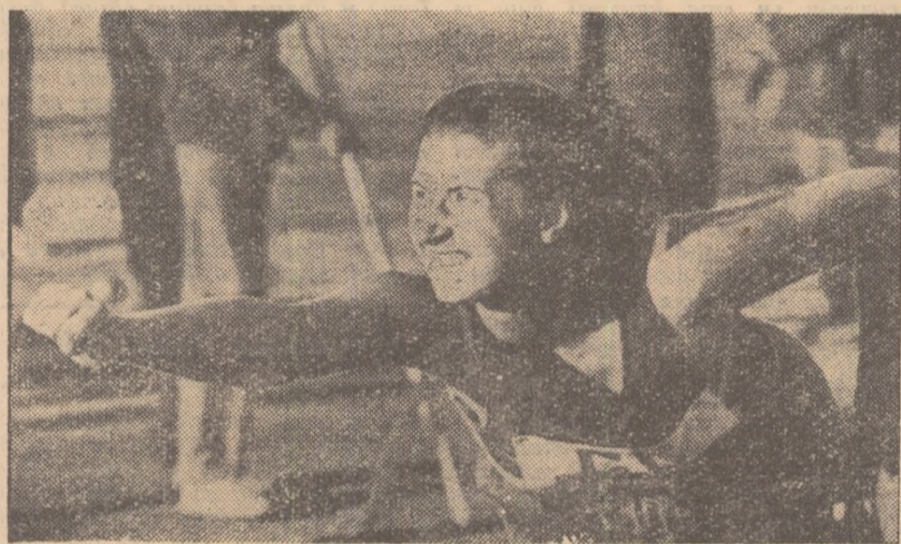
Ieri, pe stadionul Panathinaikos, Lia Manoliu a adăugat un nou succes șirului de victorii din acest sezon. Ea a devenit pentru a treia oară consecutiv campioană balcanică la aruncarea discului cu 52,09 m.

Duminică 25 septembrie: ora 9, stadion Panathinaikos, pentathlon (f); ora 15 plecare la maraton pe tradiționalul traseu Cîmpia Marathonului-Atena; de la ora 18, stadion Panathinaikos: prăjină, disc (b), înălțime (f), 200 m (b) finală, 400 m (f) serii, 110 m g finală, 80 m g (finală), 400 m (b) finală, triplu salt, 400 m (f) finală, 5000 m, 4x100 m (f), 4x400 m. Ora 21: festivitatea de închidere.