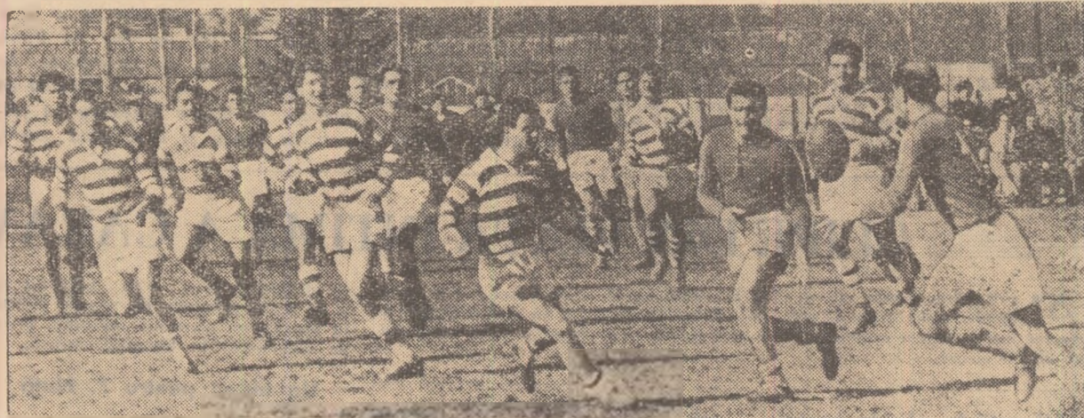
Iată o fază spectaculoasă din înținirea de campionat care a opus astăzi primăvară echipele Progresul și Știința București. Cele două formații bucureștene vor evolua miine în cuplajul din Parcul Copilului în compania unor adversari puternici.

Miine un interesant cuplaj în Parcul Copilului: C.F.R. Grivița Roșie — Progresul și C.C.A. — Știința Buc.