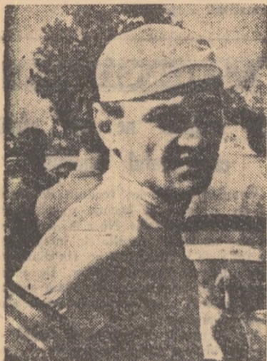
I. COSMA (R.P.R. I)

TAȘI 22 (prin telefon de la trimisul nostru). — Rareori am putut auzi la o cursă de lung kilometraj un final atât de pasionant! Turul ciclist al R.P.R., ediția 1960, ține