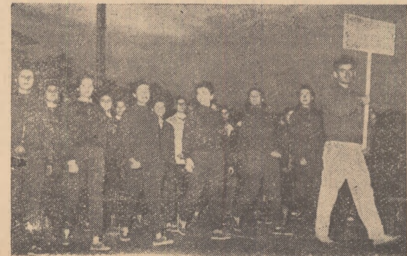
Sportivii din raionul Gh. Gheorghiu-Dej s-au pregătit cu multă atenție pentru serbarea cultural-sportivă care va avea loc duminică

Regruparea sportivilor, reparația ansamblului de gimnastică și cei 20 de sportivi și dansatori cu torțe arzînde vor încheia programul festiv al finalei Concursului cultural-sportiv al tineretului din Capitală, după ce se