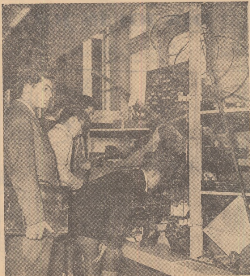
În fața standului cu material de sport.

Al 2-lea pavilion de mostre oglindește grăitor grija permanentă a partidului pentru satisfacerea nevoilor materiale și culturale mereu crescînde ale oamenilor muncii din patria noastră. Harnica noastră industrie socialistă transpune cu succes în viață sarcinile mărețe și de mare răspundere trasate în acest domeniu de cel de al III-lea Congres al Partidului.