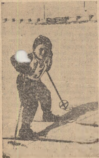
„A nins! Voi nu veniți pe munte”, pare că spune puștiul din fotografie

Schiorii fruntași au și făcut primele antrenamente pe zăpadă