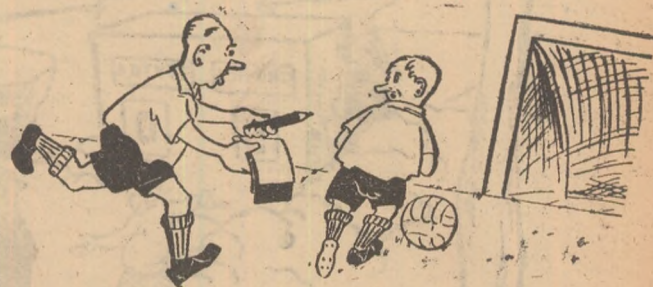
— Eu ți-am pasat mingea, dar înainte de a trage somneză-mi de primire