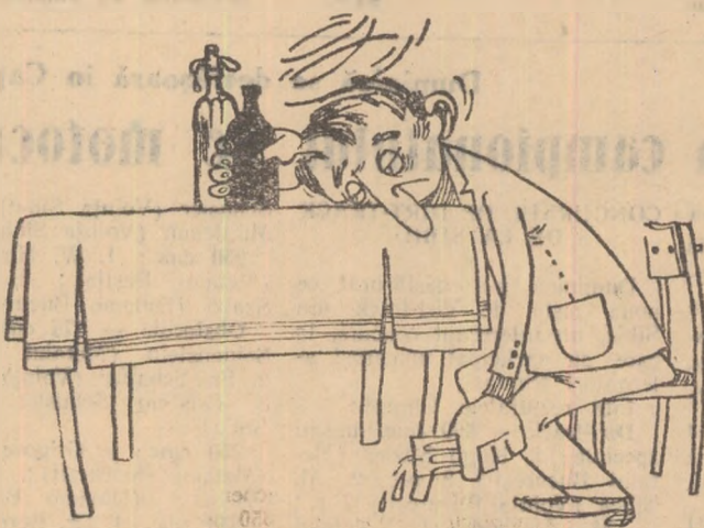
— „Bun băiat” dar... rămîne pe fază!