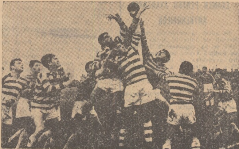
Luptă aprigă pentru balon în meciul Constructorul—Știința, cu care a fost inaugurată ediția din acest an a „Cupei Grigore Preteasa”.

Ca și în anii trecuți, deschiderea sezonului competițional de rugbi a suscitat un interes deosebit. Dovada, numărul mare de spectatori prezenți pe stadionul Constructorul, care au înfruntat frigul și vremea închisă timp de aproape șase ore!