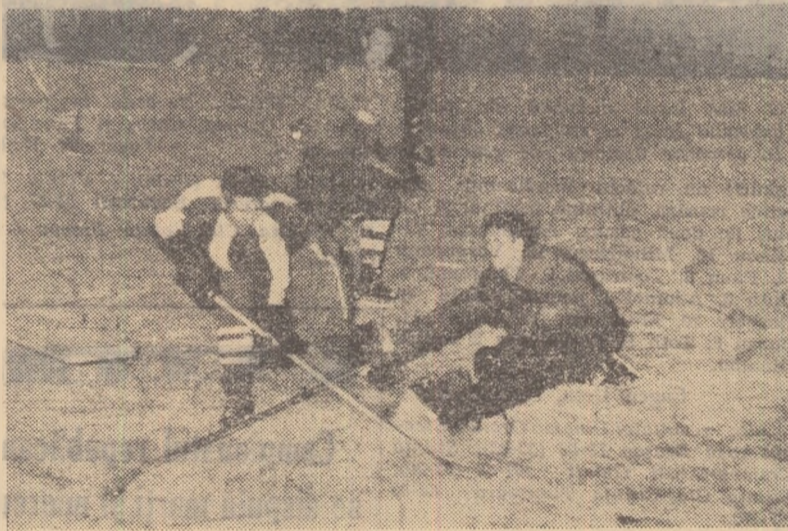
Fază din meciul Leningrad—Budapesta

În intilnirea decisivă: Leningrad—București 3-3