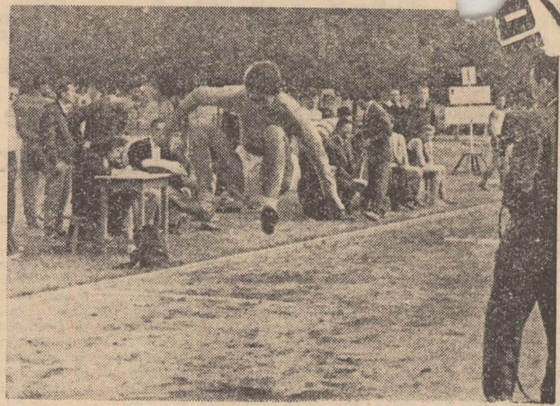
Stadionul Tineretului a găzduit duminică dimineața prima etapă din cadrul diviziei de atletism a Capitalei pentru începători.