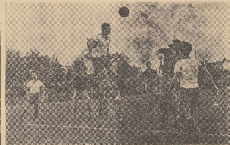
Fază din meciul de categoria B Metalul București — C.S.M. Medias. Atac la poarta medieșenilor.

ocupa locuri la periferia clasamentului. Ele vor trebui să facă eforturi pentru a se prezenta din ce în ce mai bine pregătite, deoarece numai astfel vor reuși să se mențină în această categorie. Știința Galați, însă, s-a impus prin pregătire și joc, ridicîndu-se la nivelul echipelor cu vechi stat de serviciu în categoria B. De altfel, după cinci etape se află pe locul 5 și are șanse să-și îmbunătățească situația.