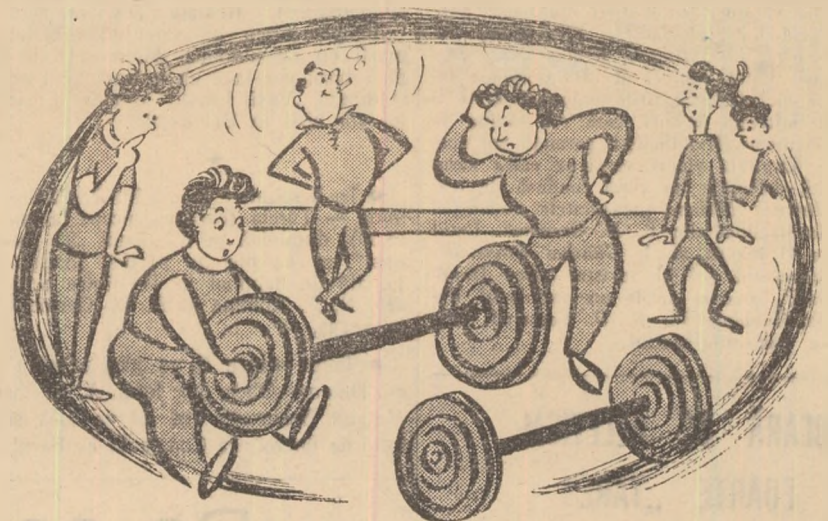
— Eh, să mai spună cineva că nu sîntem utilați cu material sportiv

În primul rînd, consiliul nu dispune de echipament corespunzător pentru a se prezenta la competiții. Materialele sportive nu sînt păstrate în condiții corespunzătoare, mulți sportivi nu restituie la timp echipamentul, folosindu-l nu numai