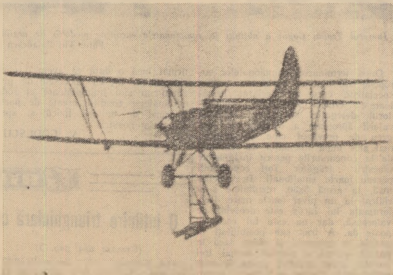
Gimnastică la trapez aerian!...