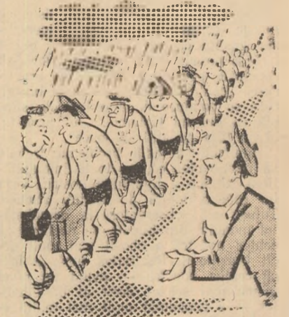
— Și tricourile, unde sînt? — La Brașov, împreună cu... restul echipei!