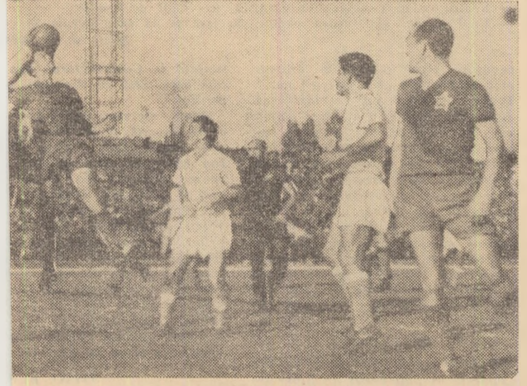
în meciul de Cupă C.C.A.— Progresul. Pentru mai multă siguranță culege balonul de pe capul unui coechipier de al său.

Dacă jocul din repriza a II-a al echipei C.C.A. a făcut ca publicul să „ierle” oarecum comportarea atît de slabă din prima parte a meciului a acelorși jucători, în schimb la Progresul nu s-a produs nici o schim- bare. Ne referim, desigur, la o schim- bare în bine. Alfel, se poate spune