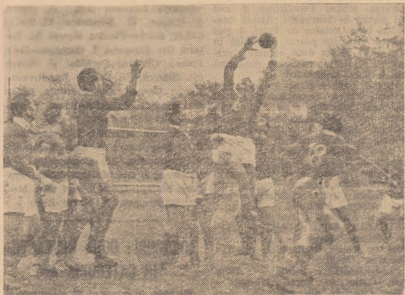
Una din numeroasele faze spectaculoase cu care au fost răsplătiți din plin spectatorii prezenti la jocul de antrenament dintre lotul republican și Progresul.