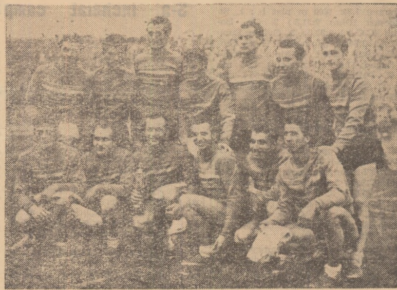
Formația C.P.B. fotografiată ieri, după primirea tricourilor de campioni

După un meci în care nu prea au strălucit (13—6 cu Drum Nou Burenii) jucătorii din Gherăești au întâlnit pe fosta campioană a țării Avintul Curcani. Începând jocul la „prindere” sportivii din Curcani au lovit pe pri-