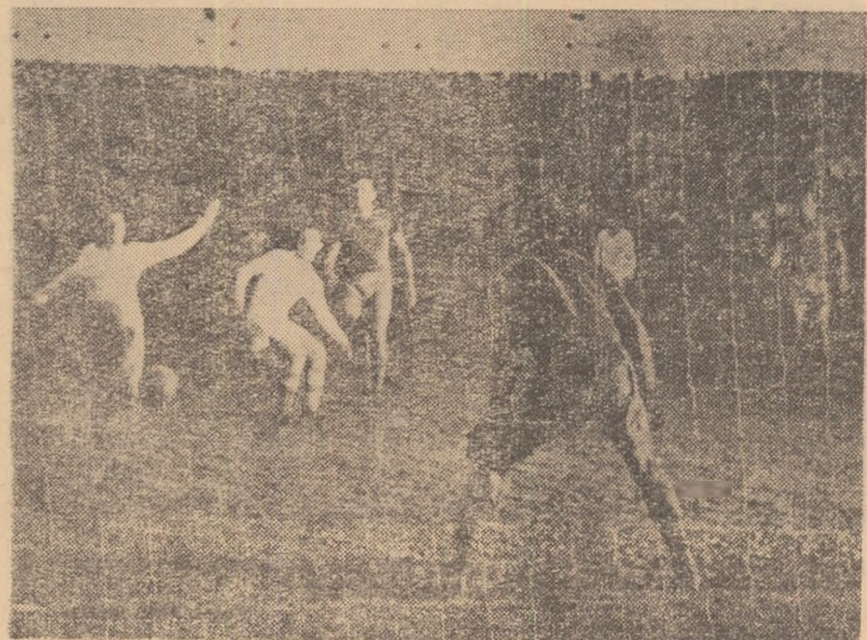
Întă un instantaneu care pare „prins” la un meci în nocturnă. Cu toată vremea închisă de ieri, înaintașul Rapidului a știut să... găsească drumul spre poarta lui Voinescu. În fotografie o acțiune a înaintării feroviare