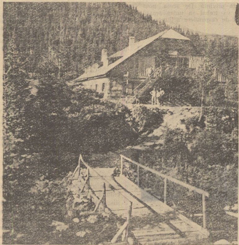
ÎN MUNȚII NOȘTRI

Sub semnătura lui Henry Garcia citim în același ziar: „În fața acestui joc trist, dezolant (n. r. al rugbiștilor francezi), care făceau publicul din Bayonne să urle, romîni dovedeau că au principii solide pe înaintare, păstrau bine mingea în linia a treia, pentru a pune pe francezi în ofsaid, debordau pe ai noștri prin vitalitate și dinamism, organizau grămizi deschise