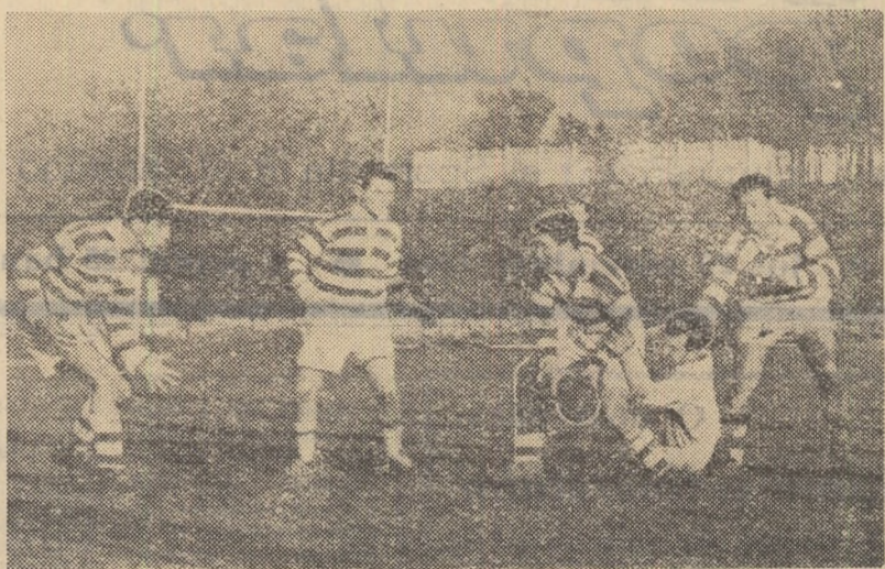
O acțiune fermă a Științei București de inițiere a unui contraatac.

Meciul de campionat, restanță, dintre Știința București și Progresul, disputat ieri pe stadionul Progresul s-a încheiat cu un echitabil rezultat de egalitate: 3—3 (3—0). În ansamblu,