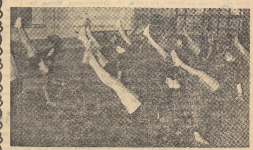
Aspect din timpul orei de educație fizică a elevilor din clasa a XI-a G de la Școala medie nr. 1 din Brașov