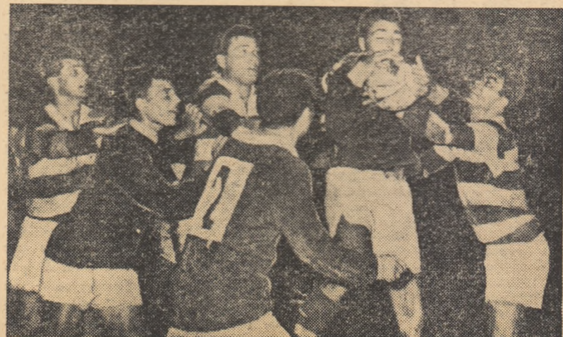
De fiecare dată, întîlnirile echipei lor Grivița Roșie și Dinamo au pasionat miile de spectatori, constituind veritabile „derbiuri” rugbistice. Miine, în cadrul primei etape a „Cupei 6 Martie” care inaugurează sezonul competițional din acest an, vom avea din nou prilejul să aplaudăm jocul tehnic și spectaculos al acestor două echipe.

Arbitrul întîlnirii, care este programată în sala Floreasca de la ora 19, va fi G. Mihalc (R.D.G.).