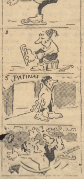
Desen de N. GHENĂȚIE

cerii atacului ș.a. sunt prezentate cu mult simț pedagogic, astfel încât cititorul și le însușește cu ușurință, cu toate că autorul pătrunde uneori chiar în subtilitățile jocului.