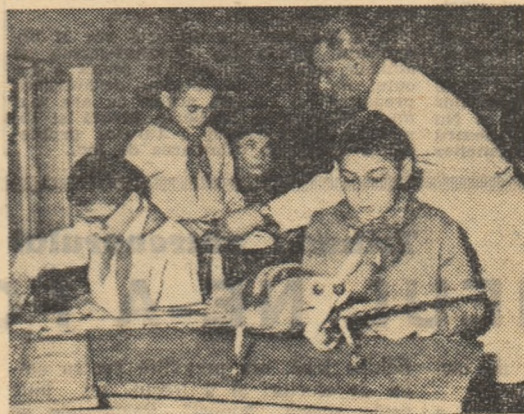
Pasiune și îndeminare: aeromodeliștii de la Palatul Pionierilor se pregătesc de pe acum pentru concursul din primăvară

Desigur, activitatea celor peste 2.000 de sportivi, ciți are Palatul Pionierilor, nu se rezumă