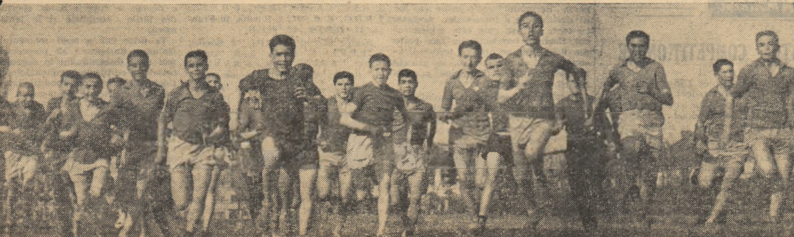
Juniorii și-au început întrecerea! Dorința de victorie este neapuse de mare.