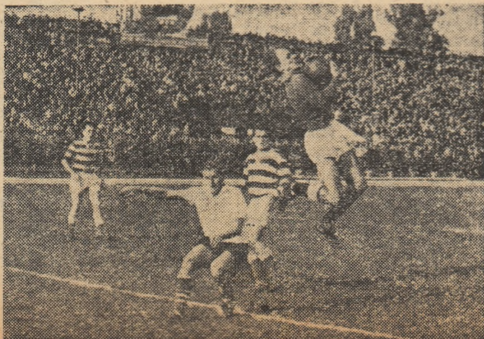
Cozma a sărit și a interceptat balonul. Tircovnicu și Pașcanu erau gata să intervină, fiecare hincîntes cu alte intenții...

Amatorii de box din Capitală se întînesc astăzi-seară, pe stadionul Republicii