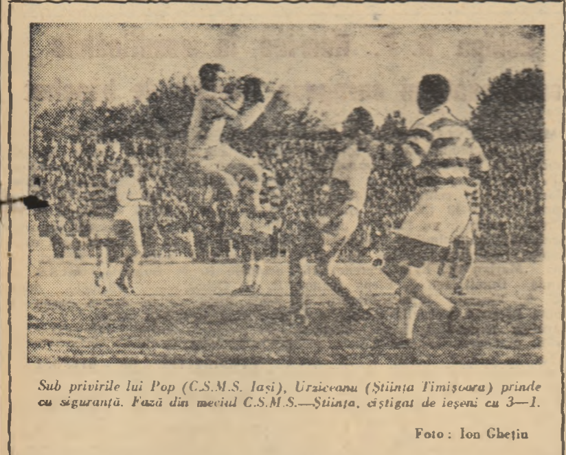
Sub privirile lui Pop (C.S.M.S. Iasi), Uraicvanu (Știința Timișoara) prinde cu siguranță. Fază din meciul C.S.M.S.—Știința, cîștigat de ieșeni cu 3-1.

Dar despre asta, într-un articol viitor.