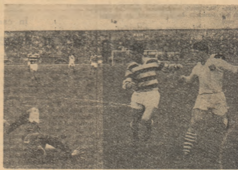
Atac la poarta lui Dinamo Bacău: Baboie nu-l mai are în față decît pe Ghiță, dar va trage alături de poartă...