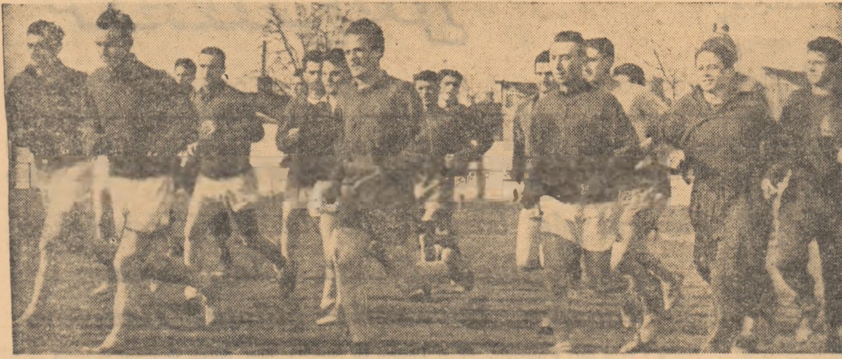
Participanții la întrecerile de cros de la asociația sportivă Autobuzul din Capitală au făcut zilele trecute o ultimă pregătire. Iată în fotografie un aspect de la antrenamentul desfășurat pe terenul Viitorul.

Devenite tradiționale, întrecerile de cros organizate în întimpinarea zilei de 1 Mai se bucură de o largă popularitate.