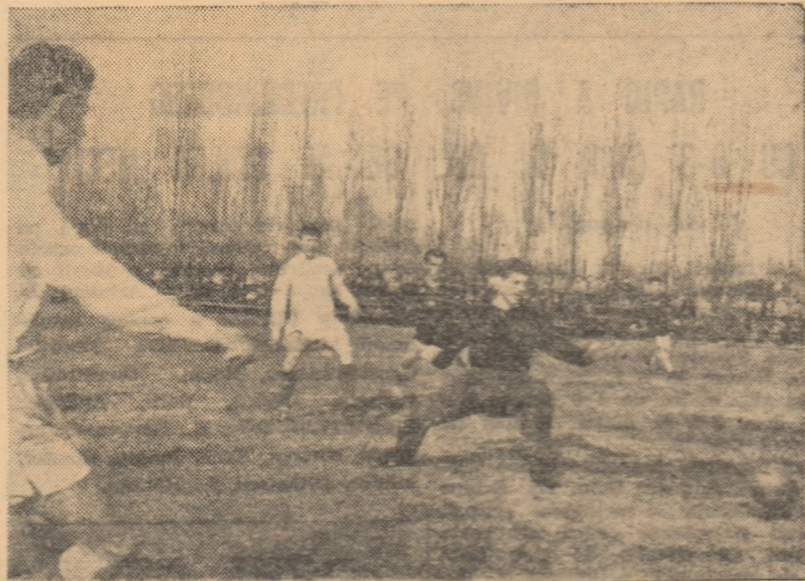
Atac al „olimpicilor” la poartă echipei Dinamo Obor.

Având în vedere interesul manifestat de către „olimpici” pentru joc, ca și re-