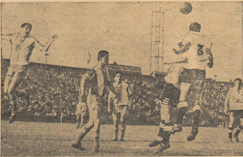
O fază din meciul Progresul — Farul, disputat duminică pe stadionul Republicii: stoperul constănțean Tilvescu respinge un atac al gazdelor.