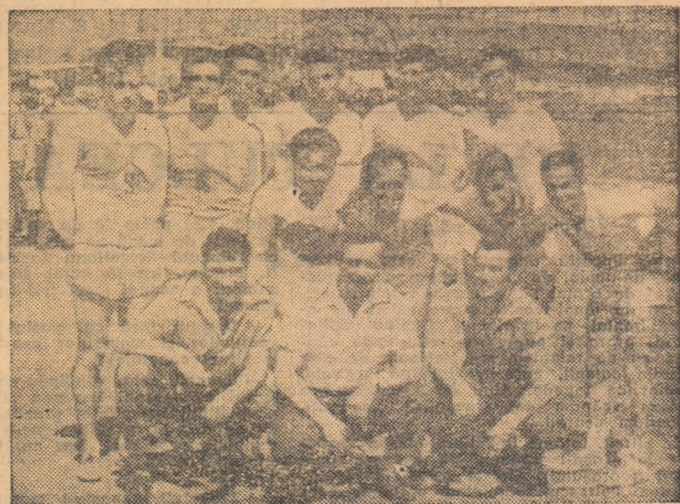
Echipele de volei a asociației sportive Șteful din Tulcea, pentru a treia oară consecutiv campioană regională.