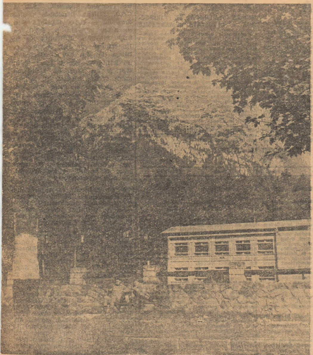
Bușteni. Vedere spre Caraiman