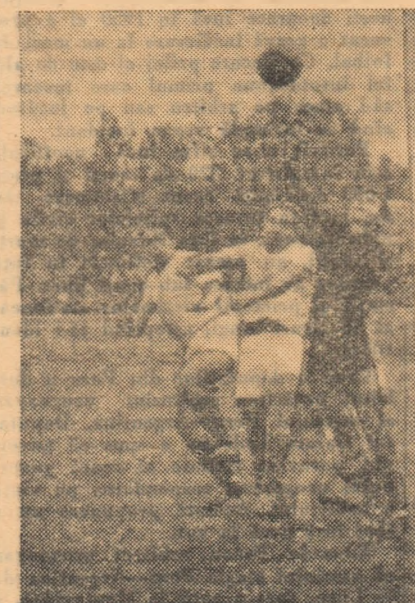
Portarul dinamovist boxează balonul la unul din puținele contraatacuri ale Electriciei. (Fază din meciul Dinamo Victoria București—Electrică Constanța 7-0).

meciuri bune au mai fost: C.F.R. Arad- Pandurii Tg. Jiu (5-1) în care ce- feriștii, cu toate că au aliniat o echipă intinerită, au realizat cel mai bun meci al lor din actualul sezon; Vago- nul Arad-Electroputere Craiova (3-0), unde liderul seriei Vest și-a asigurat victoria încă din prima re- priză, cînd a practicat un joc spec- taculos și de bun nivel tehnic; Rapid Tg. Mureș—Metalurgistul Baia Mare (3-0), remarcabil prin fazele dina-