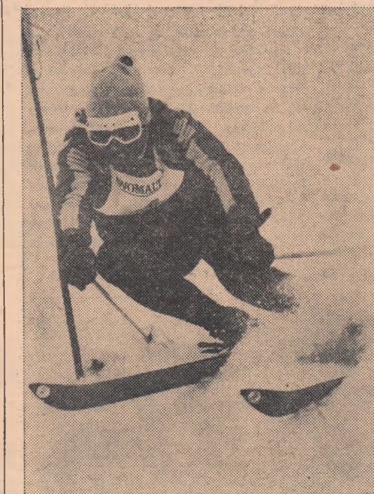
Unul dintre cei mai valoroși schiori francezi, Leo Lacroix, în cursa de slalom uriaș de la Adelboden în care s-a clasat pe primul loc

În urma anchetei sportive întreprinse de agenția poloneză de știri „P.A.P.” în rîndul a 23 de agenții internaționale de presă, titlul de cel mai bun sportiv al anului 1964 din Europa a fost acordat multiplei campioane olimpice de patinaj viteză Lidia Skoblikova (U.R.S.S.). În continuare, clasamentul se prezintă astfel: Joseph Schmidt (R.P. Polonă) — atletism; Mary Rand (Anglia) — atletism; Leonid Jabolinski (U.R.S.S.) — haltere; Jacques Anquetil (Franța) — ciclism; V. Ivanov (U.R.S.S.) — canotaj; W. Holdorf (R.F.G.) — atletism; Vera Ceaslavska (R. S. Cehoslovacă) — gimnastică; Gaston Roelants (Belgia) — atletism și Tamara Press (U.R.S.S.) — atletism.