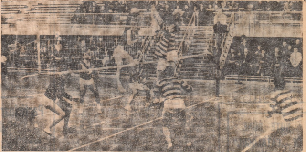
„Duel” la fileu în partida Rapid — Dinamo Bihor. Printr-o fentă de... ultimă clipă, Plocon reușește să trimită mingea pe lângă blocajul advers