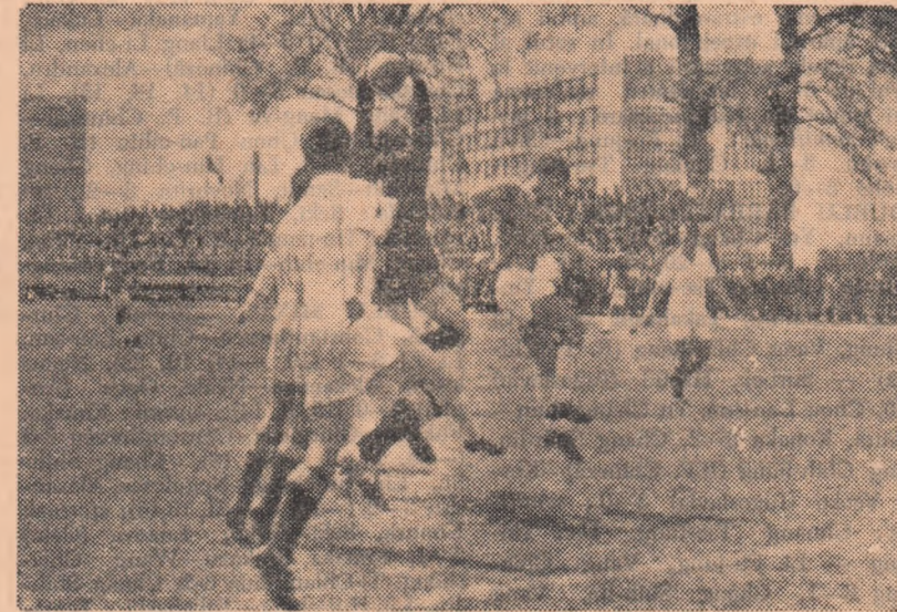
Fază din meciul Știința București — Poiana Cimpina

ETAPA VIITOARE: Ind. sirmei C. Turzii — A.S.A. Tg. Mureș, Sătmăreana — C.F.R. Timișoara, Știința Timișoara — Jiul Petritla, Minerul Lupeni — Gaz metan Mediaș, Recolta Carei — Clujeana, A. S. Cugir — C.S.M. Reșița, Vagonul Arad — C.S.M. Sibiu.