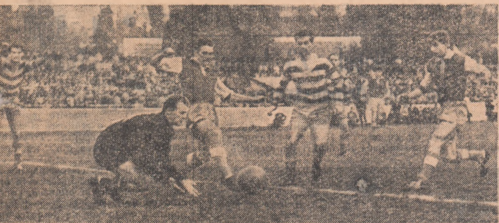
Ultimul cuplaj interbucureștean. În fotografie, fotoreporterul nostru V. Bageac i-a surprins pe Costeșcu și Dumitriu „asaltînd” poarta lui Cosma, în meciul Progresul—Rapid din turul campionatului