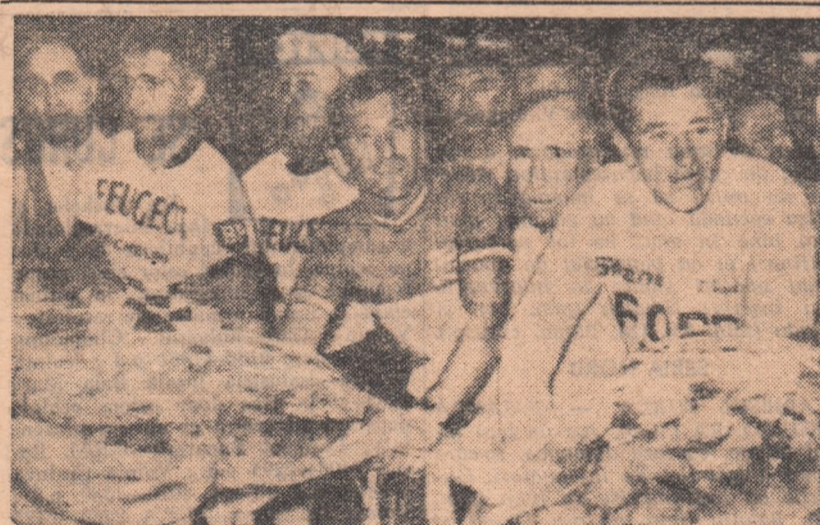
JACQUES ANQUETIL FACE TURUL DE ONOARE...

Proba supremă de rezistență a cicliștilor, cursa Bordeaux—Paris (557 km) — cea mai lungă cursă ciclistă din lume, a fost câștigată la actuala ediție de cunoscutul rutier francez Jacques Anquetil. Iată-l pe învingător (dreapta) făcînd turul de onoare al velodromului Parc de Princes, împreună cu următorii doi clasafi în întrecere, compatriotul său Jean Stablinsky (mijloc) și englezul Tom Simpson.