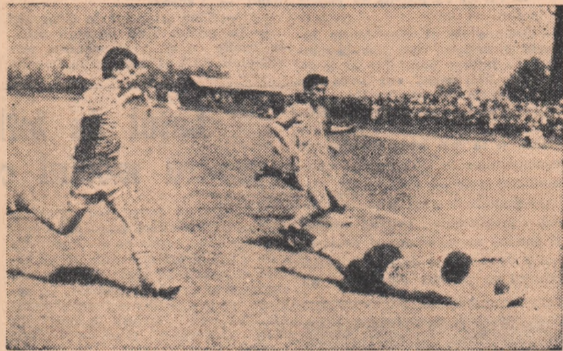
Fază din meciul Tehnometal București-Unirea Răcari (2—0).