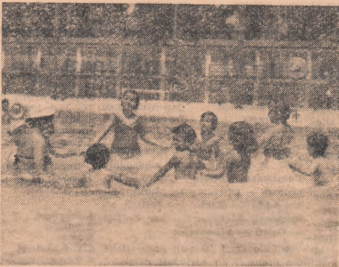
În prima zi joacă, deci acomodare cu apa cristalină înaintea lecției propriu-zise. Fotografia ne arată un aspect din cursul unei lecții la centrul de învățare a înotului inaugurat ieri la strandul Tineretului.