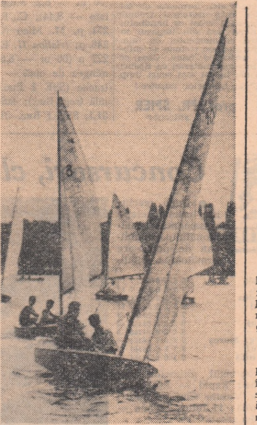
Sportivii bucureșteni, profitînd de o ușoară adiere de vînt, au continuat întrecerile de iahting pe lacul Herăstrău în cadrul campionatului Capitalei.

● Organizarea unor mari competiții în care mii de tineri se vor întrece la fotbal, atletism, volei, orientare turistică, handbal, șah etc. ● În vederea popularizării unor ramuri sportive, în zilele de 11 și 18 iulie se vor organiza interesante demonstrații la disciplinele cele mai îndrăgite în regiune. ● Cu ocazia a două concursuri de alpinism, la Vadul Crișului se va fixa o placă comemorativă cu inscripția „Congresul al IV-lea al P.M.R.”. ● Iubitorii sportului din regiunea noastră vor amenaja, prin muncă patriotică, peste 300 de terenuri sportive simple.