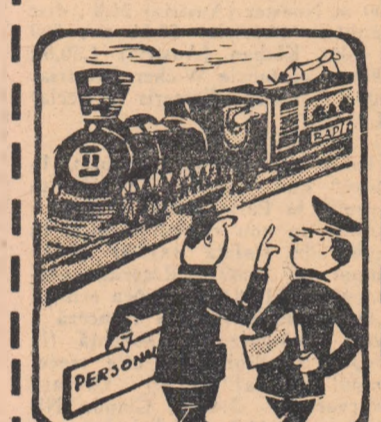
— La început a fost... „rapid”, apoi „accelerat” și în cele din urmă a devenit... „personal”.