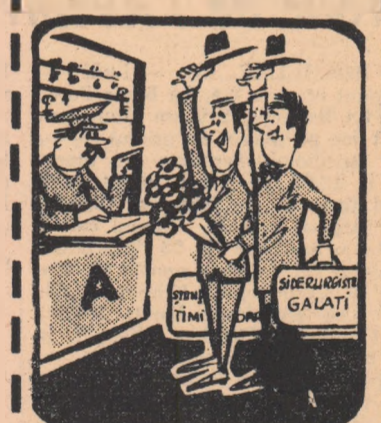
— Definitiv, sau tot flotanți?