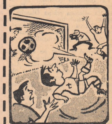
Exemple: Cînd vrei să fie neapărat campionatul, marchezi și așa!