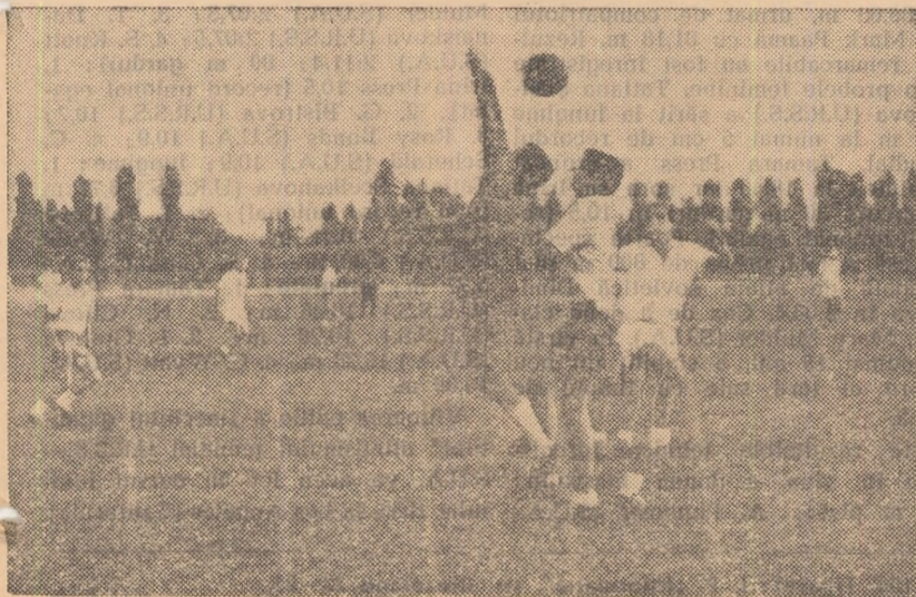
Fază din meciul de antrenament Dinamo Victoria—Voinea

Rezultatele întrecerilor juniorilor și junioarelor de categ. a II-a le vom publica în numărul nostru de marți.