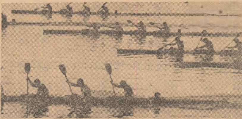
Una din cele mai disputate probe a fost și cea de caiac 4 1000 m seniori în care echipajele noastre au ocupat locurile 1 și 2

...au început duminică dimineață cu semifinalele probei de caiac simplu 1000 m seniori. Atât Andrei Conțolenco, cât și celălalt reprezentant al nostru, Mihai Turcaș, nu s-au menținut în lupta pentru calificare decât jumătate de traseu, din cauza lipsei de resurse. REZULTATE: semifinala I: 1. J. Wenzke (R.D.G.) 3:55,46; 2. R. Peterson (Sue.) 3:55,82; 3. W. Szuskewicz (Pol.) 3:56,65; 4. H. W. Knudsen (Dan.) 3:59,11; 5. A. Geurts (Hol.) 4:01,51; 6. E. Blasek (RFG) 4:14,11; semifinala a II-a: 1. E. Hansen (Dan.) 3:50,71; 2. I. Kemecsei (Ung.) 3:54,39; 3. G. Pfaff (Aus.) 3:54,95; 4. A. Conțolenco (Rom.) 3:56,17; 5. M. Vaclav (Ceh.) 4:07,94; 6. B. Schulze (RFG) 4:17,82; semifinala a III-a: 1. U. Will (R.D.G.) 4:01,65; 2. I. Szöllösi (Ung.) 4:01,78; 3. P. Hvasil (Ceh.) 4:02,60; 4. H. Nae-