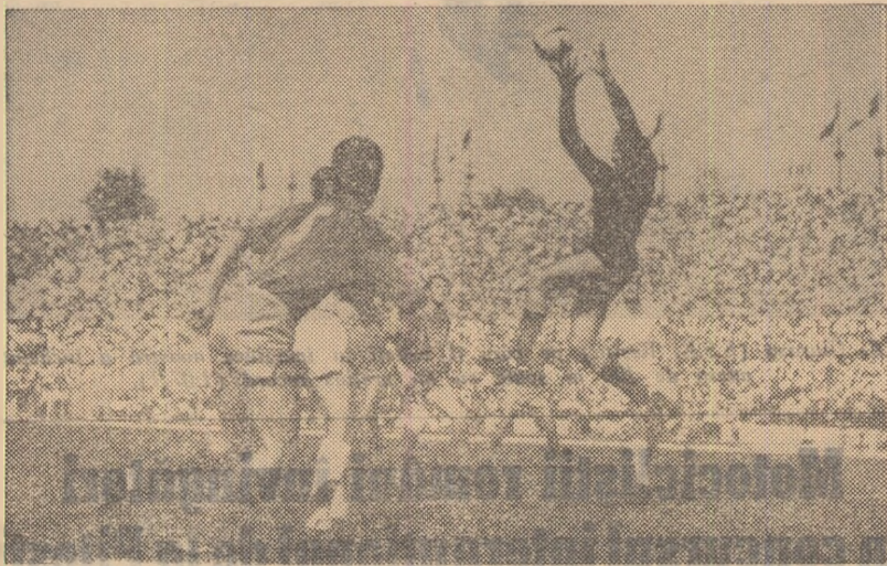
Haidu prinde cu ușurință o minge „înlaltă”

CITITI IN NUMARUL DE MIINE, CRONICILE ȘI CLASAMENTELE CATEGORIEI B