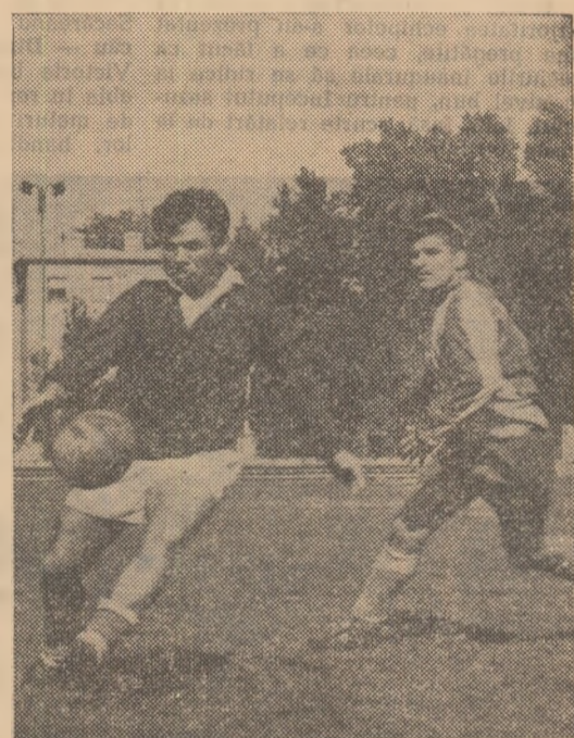
Fază din meciul de rugbi Progresul—Rulmentul Birlad

S-a jucat mai mult pe înaintare, iar grămada celor de la Gloria, incomodă, reușește să-i împiedice pe rugbiștii de la Grivița Roșie să-și pună în valoare linia de 3/4, încît la pauză scorul este încă egal. La reluare, jocul se duce în principal tot pe înaintare pînă în min. 60, cînd scorul indică 9-9. În acest moment Gloria începe să cedeze și înaintașii de la Grivița Roșie reușesc să aprovizioneze cu multe mingi fructificabile linia de 3/4, în care se intercalează fundasul Irimescu (cel mai bun de pe teren). Din păcate, jocul ajunge să degeneze din cauza nervozității (promotorii rugbiștii de la Gloria, „continuatori” gazdelor — dintre care Manole s-a „evidențiat” și a fost eliminat), iar C. Stănescu e accidentat. În ultimul minut de joc, în busculada generală din buturile Gloriei intervine un grup de spectatori. Vom reveni, de altfel, asupra