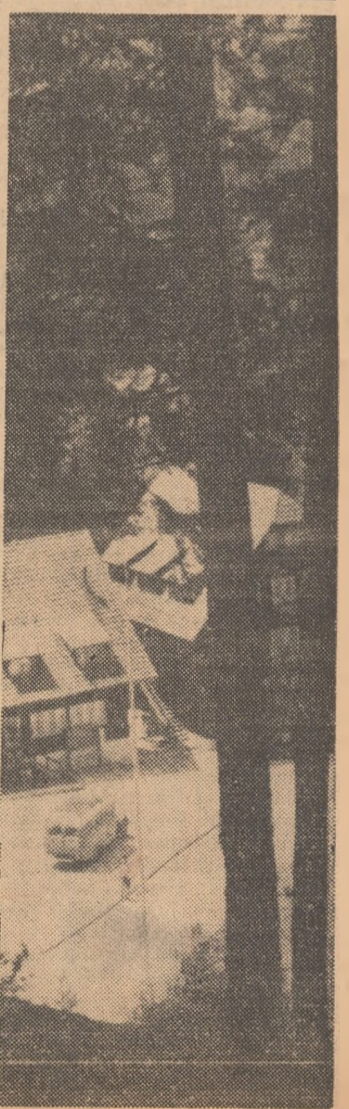
Cabana de pe Valea Prahovei vă invită la drumetie

Chineză care au și efectuat câteva antrenamente. În cursul acestora, ei au justificat pe deplin locul secund ocupat în patru din cele cinci ediții ale „Dinamoviadei“ și au arătat că sint capabili să repete performanța din 1960, când au cucerit primul loc în disputa de la Pekin. În zilele următoare sint așteptați sportivii din Bulgaria, Cehoslovacia, R. D. Germană, Polonia, Ungaria și U.R.S.S. care, alături de baschetbaliștii români, își vor măsura forțele începând de marți 21 septembrie.