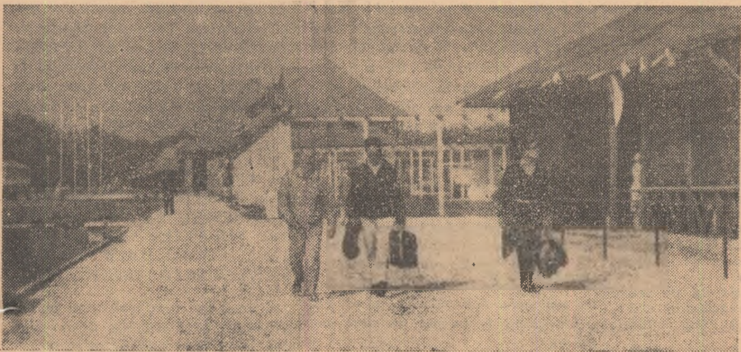
Poligonul Tunari, înnoit, este gata să găzduiască campionatele europene.