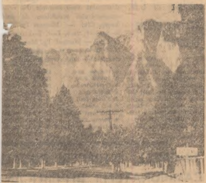
În Văii Prahovei. Acest fermecător colț al Văii Prahovei vă invită parcă să revedeți din nou pitoroasa regiune.