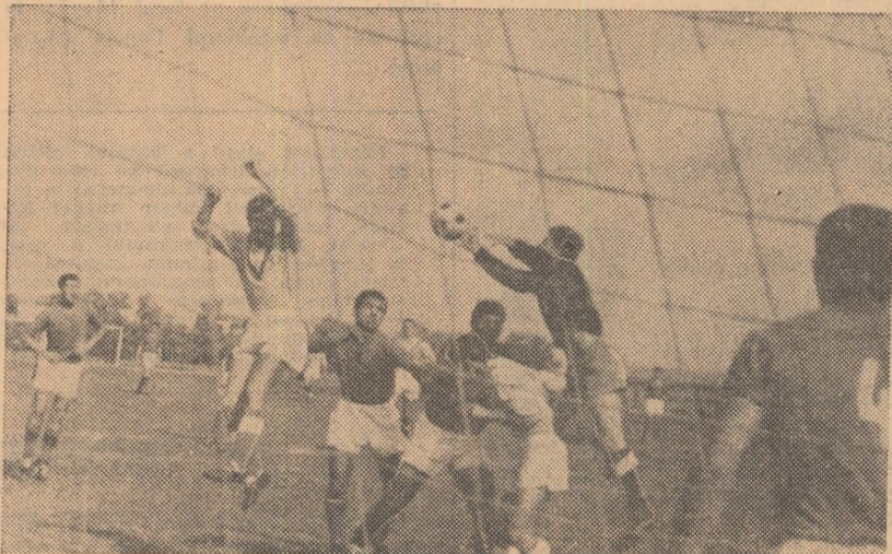
Fază din întâlnirea dintre Tehnometal Buc. — Marina Mangalia 2-1 (2-0)

TRACTORUL BRAȘOV—FLACĂRA ROȘIE BUC (6-0). Brașovenii au jucat decizi în atac și au câștigat categoric. În tot timpul celor 90 de minute, oaspeții