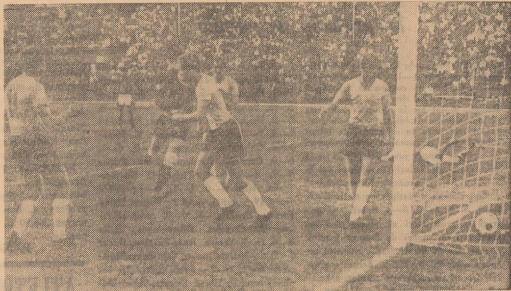
Minutul 85. 3-0 pentru Dinamo. A înscris Frățilă.

Biblioteca Centrală Regională H. H. Rădulescu Dinamo București — „B. 1909” Odense 4-0 (0-0)