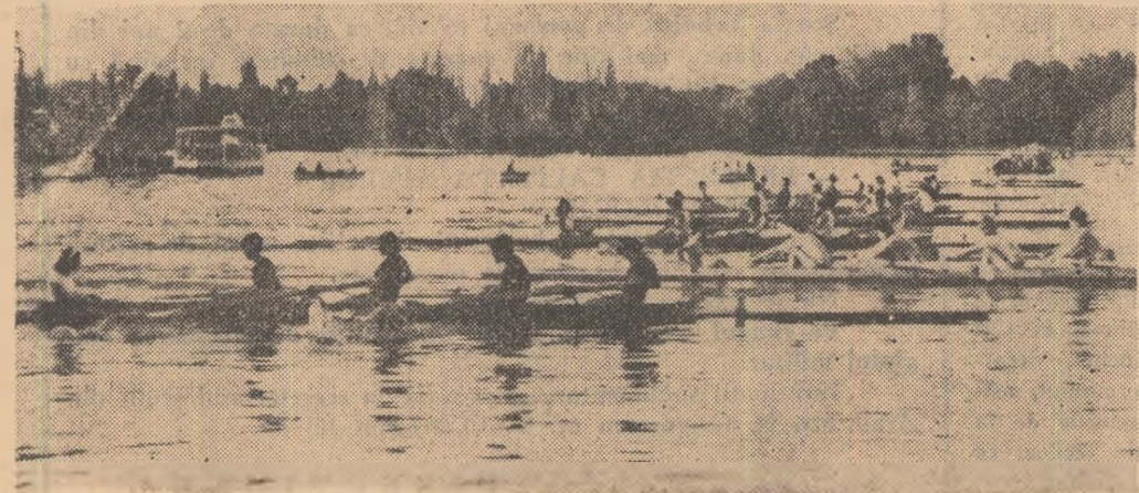
Aspect din întrecerea schiurilor de 4+1 rame.