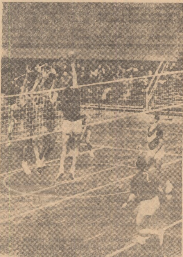
Ne-o prilejuieste etapa inaugurală a campionatului republican masculin. În Capitală — azi la Giulești — meciul Rapid — Steaua, confruntare întotdeauna bogată în momente de spectacol valoros. Vă oferim aici o imagine de la o întâlnire Rapid — Steaua (3—1) din ediția precedentă: în atac, Grigoriyici (Rapid) „pune” în spațiile blocajului advers.