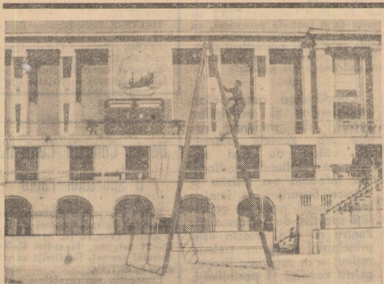
Ultimele rețușuri. Se montează tabela electrică de scor