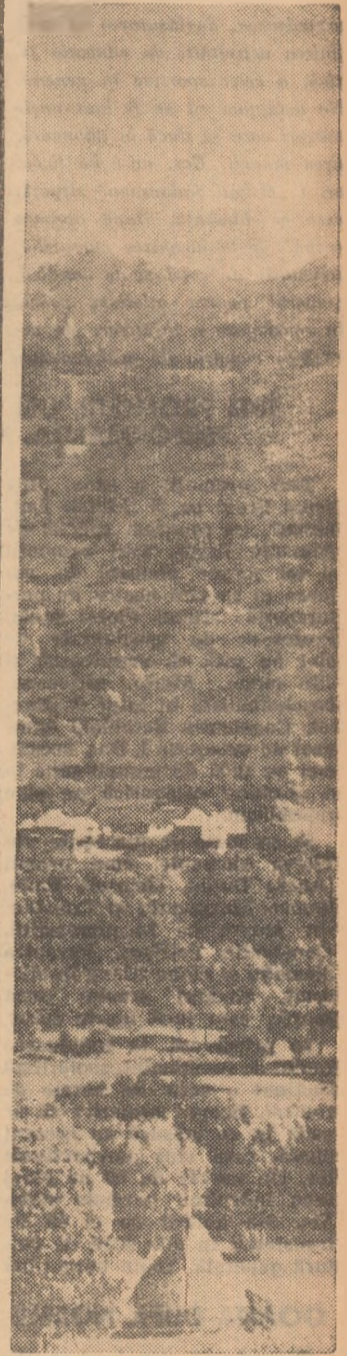
Fundata, o mică așezare de munte între Bran și Rucăr, străjuită de o parte și de alta de munți înalți are un peisaj caracteristic satelor montane. Pirițele de schi din apropiere sînt renumite, ca de altfel și schiorii care provin de pe aceste meleaguri

Precum se știe regiunea noastră va fi prezentă în noul campionat al categoriei A de volei cu două echipe: la băieți Viitorul T. C. Bacău iar la fete A. S. Țesătura 8 Martie Piatra Neamț. Consiliile celor două asociații sportive au luat toate măsurile ca formațiile lor să aibă condiții din cele mai bune de pregătire. Voleibaliștii bă-