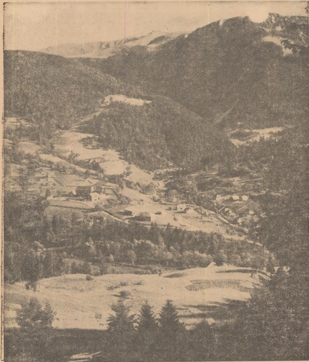
Vedere generală a complexului turistic și sportiv Borșa, loc preferat de turiști în toate anotimpurile și pe timp de iarnă de schiori. De aici începe poteca turistică spre Pietrosul Rodnei.

Ajunși la complexul turistic și sportiv Borșa din regiunea Maramureș, amatori de drumeție au prilejul să urce pe cel mai înalt vîrf din Munții Rodnei, de unde se poate admira o panoramă de-a dreptul monumentală.