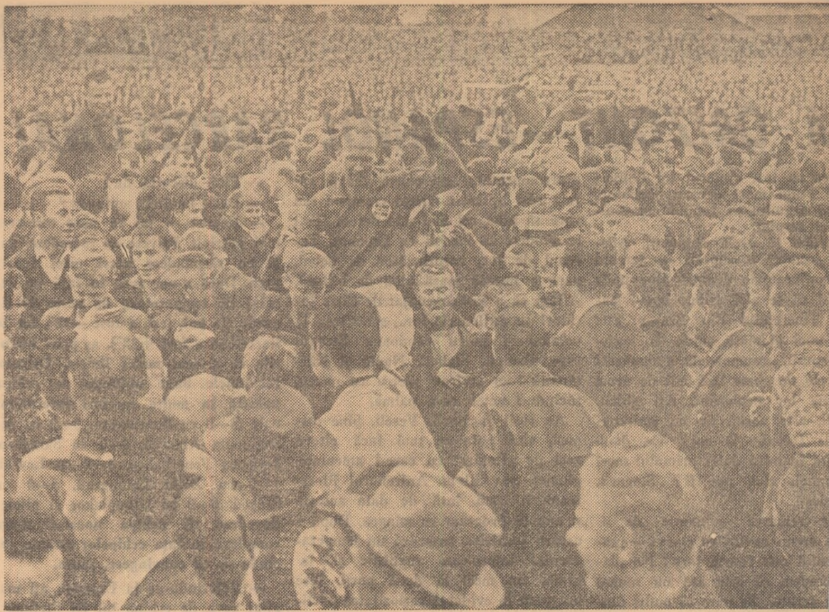
Infrîngerea echipei Iugoslaviei la Oslo de către reprezentativa Norvegiei (0-3) poate fi considerată drept mai mare surpriză a anului fotbalistic 1965. O mare de oameni a invadat terenul de la Oslo pentru a-i purta brațe pe jucătorii norvegieni.

A doua finală a avut loc la Londra și a dat cîștig de cauză tot echipei