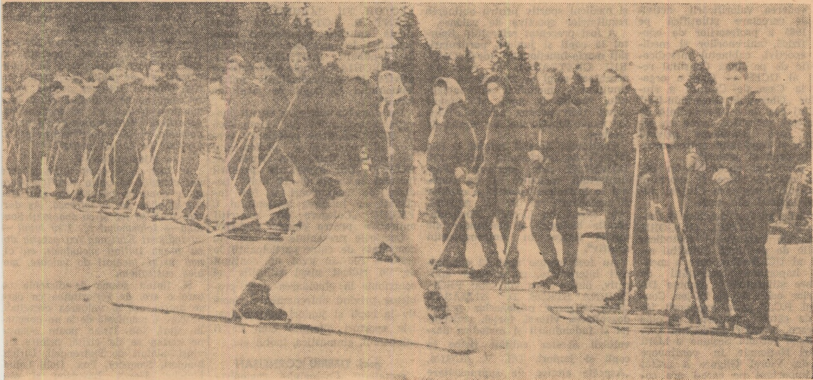
ecție de sezon pe tema „a.b.c.-ui schiului”. Se explică ocolirea în plug.