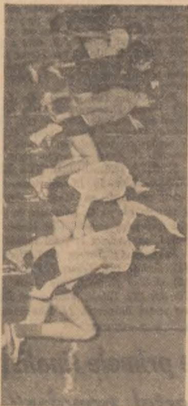
S-a dat startul într-o serie a cursei de 50 m junioare