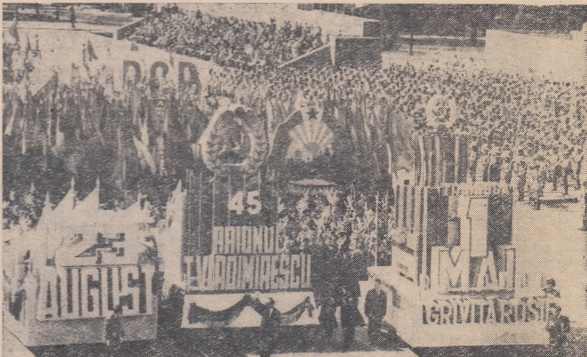
Oamenii muncii din Capitală raportează succesele obținute în cinstea aniversării Partidului și a zilei de 1 Mai

Demonstrația oamenilor muncii din Capitală ia sfîrșit cu tradiționala paradă a sportivilor. În mijlocul coloanelor se află un car alegoric ce ilustrează puternica dezvoltare a sportului de masă din țara noastră cuprinzînd astăzi peste 4 milioane de tineri și tinere. Cupe și medalii purtate de sportivi vorbesc despre succesele lor în marile confruntări internaționale. Stirnește ropote de aplauze alcătuirea de către sportivi, cu corpurile lor, a datei acestei sărbători — 1 Mai. Urale puternice izbucnesc atunci cînd în câteva clipe trupurile sportivilor, în costume roșii, formează cu uriașe litere, pe un fundal de steaguri ale partidului — P.C.R. Grupuri de sportivi înscriu, de asemenea, în fața tribunei inițialele republicii noastre socialiste și cuvîntul Pace.