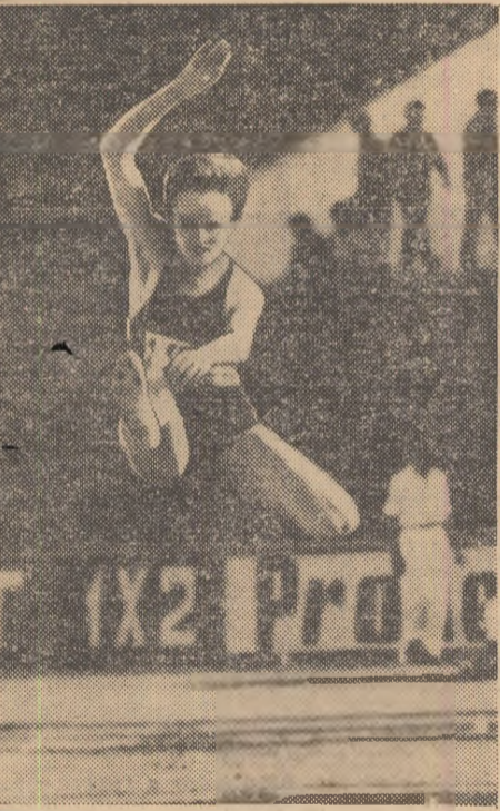
Viorica Viscopoleanu și-a adăugat la colecția sa un nou titlu de campioană a țării