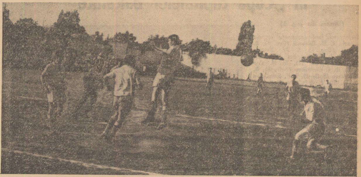
Fază din meciul Flacăra roșie — Tehnometal, disputat în cadrul „Cupei de vară“