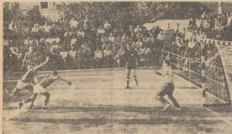
Fază din meciul internațional de handbal disputat sâmbătă la Ploiești între Rafinăria Teleajen și Selecționata orașului Berlin, câștigat de prima echipă cu 13-12.

Între 1 și 4 septembrie se desfășoară la Copenhaga Congresul F.I.H., la care participă ca repre-