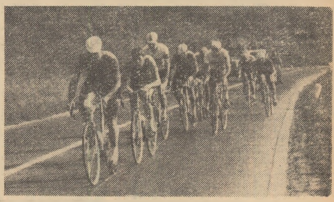
Aspect din etapa a V-a

În imagine, fotoreporterul nostru Teodor Roibu a surprins un aspect din timpul întrecerilor.