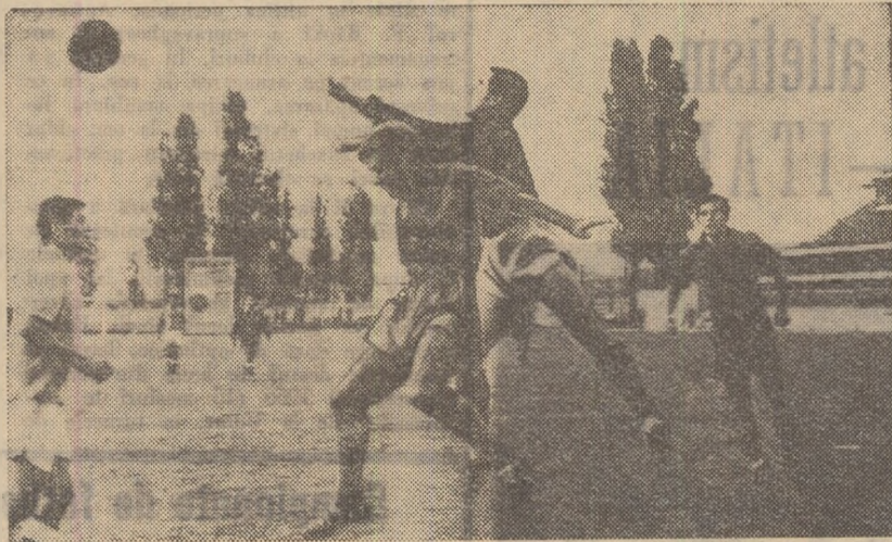
Moment de mare tensiune la poarta rașiorenilor. Fază din meciul Tehnometal București — C.F.R. Roșiori 0-0.

ETAPA VIITOARE: Flacăra roșie Buc. — Metalul Tirgoviște, Dunărea Giurgiu — Progresul Corabia, C.F.R. Roșiori — S.N. Oltenița, Portul Constanța — Stuful Tulcea, Electrica Fieni — Electrica Constanța, Oltul Sf. Gheorghe — Muscelul Cimpulung, I.M.U. Medgidia — Tehnometal București.