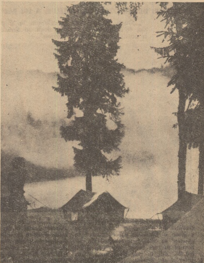
In zori...