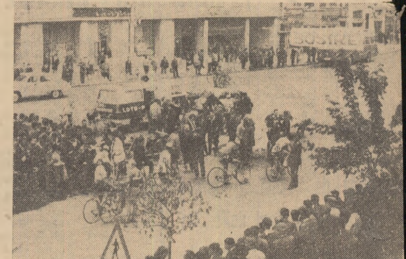
Mare animație în centrul orașului Tg. Mureș, de unde s-a dat startul și unde a avut loc sosirea în etapa a VI-a, contratimp individual, a Turului ciclist al României

„marea carte“ la contratimp. Tinerii — sau, mai bine spus, o-dintre ei — au rezistat cu succes, gindu-ne să-i includem de pe acum-pe ei pe lista vedetelor. Și mai exi-listă pe care candidează cu succes- ceea a selecției pentru Jocurile Olim-de la Ciudad de Mexico.