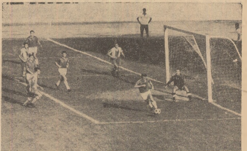
Fază din meciul Dinamo București—Progresul