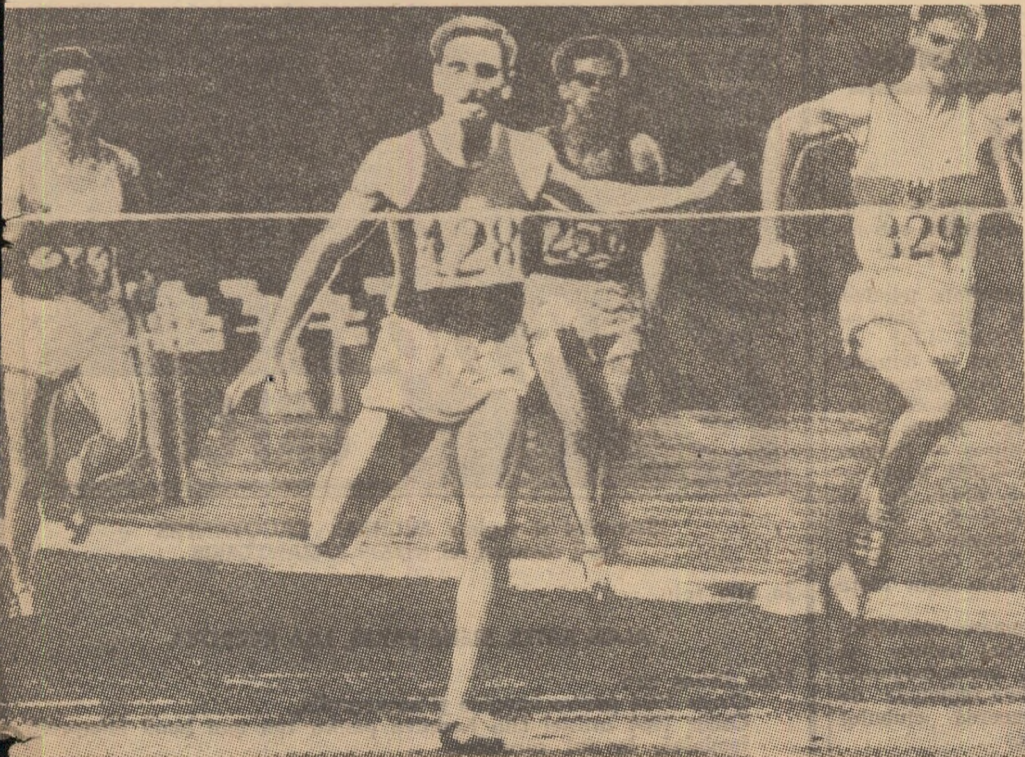
Roberto Frinolli, campionul european al cursei de 400 m garduri

Atleții noștri, reînforși luni seară de la Balcaniada de la Sarajevo, își continuă pregătirile pentru meciul ROMÂNIA—ITALIA. Ei sînt decise să facă totul pentru o comportare cât mai bună.