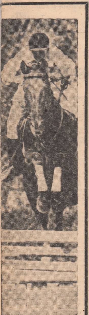
PESTE OBSTACOL...

Fotbaliștii echipei Steaua n-au reușit să refacă diferența minimă de 0-1 din deplasare și, terminînd la egalitate (1-1) cu R. C. Strasbourg, au fost eliminați din „Cupa cupelor”. (Citiți cronică meciului în pagina a IV-a).