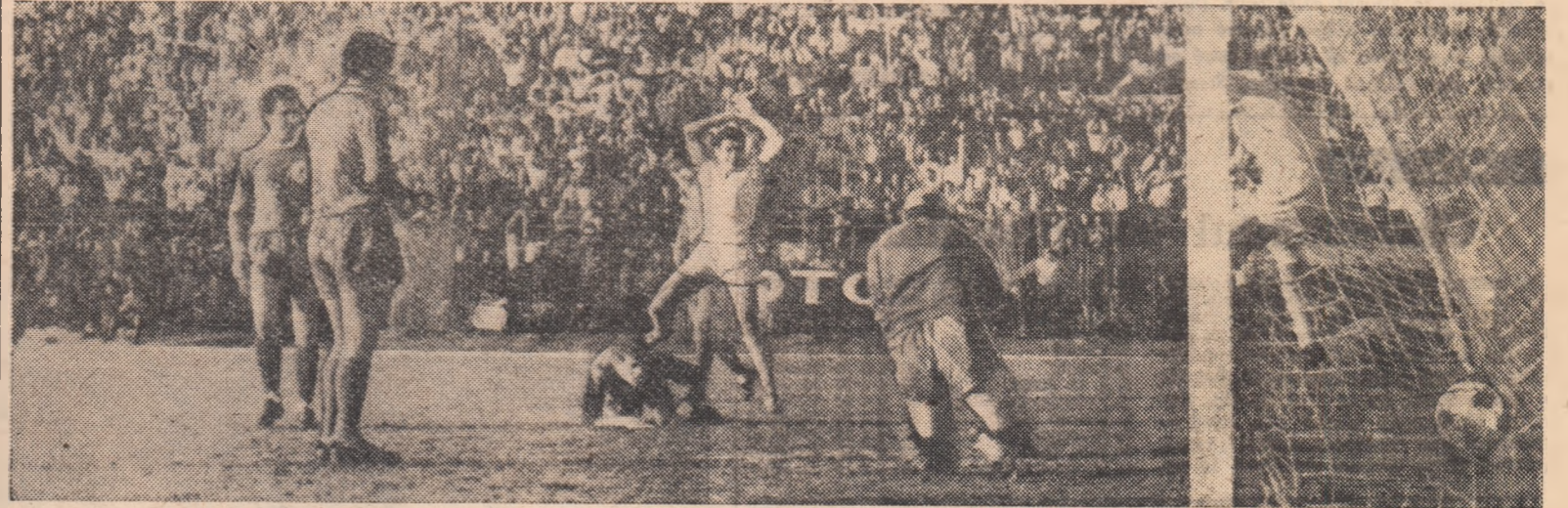
Petrolul a înscris primul gol: explozie de bucurie în tabăra gazdelor, dezamăgire în formația oaspeților...