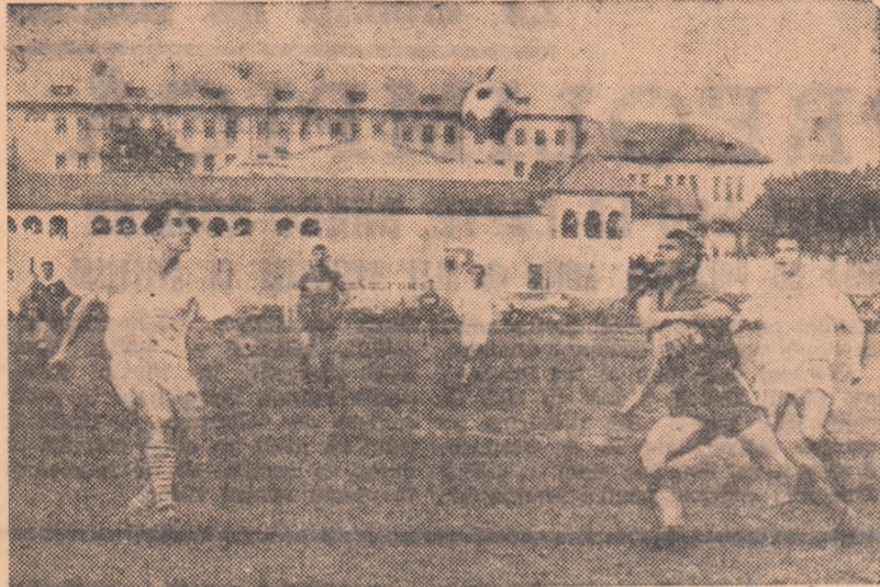
O fază dintr-un meci disputat la Craiova, în campionatul trecut: Știința — Dinamo Pitești, 1-0.