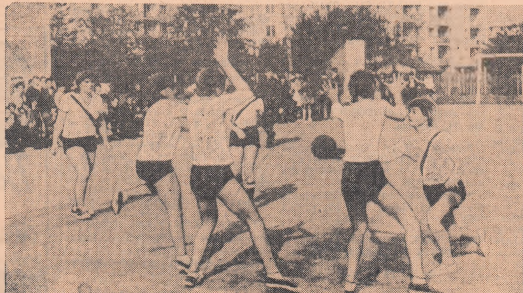
Întrecerea handbalistelor este foarte disputată. Fiecare echipă dorește să câștige. Iată, în imaginea noastră, o atacantă aruncînd la poartă