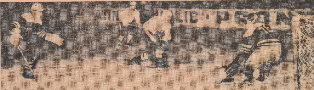
Fază din meciul Dinamo București — Voința Miercurea Ciuc

Dinamo Buc. — Voința Miercurea Ciuc 8-2 (0-1, 2-0, 6-1). Confirmînd forma