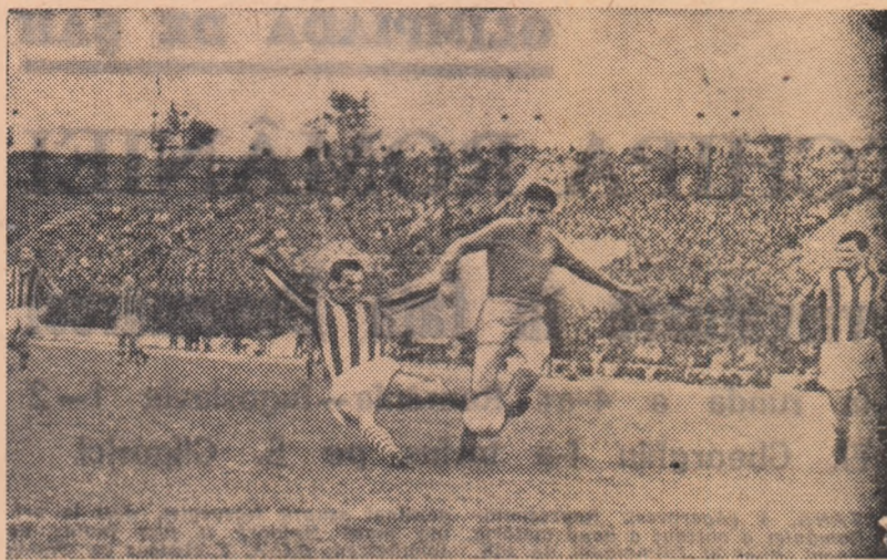
Constantin I-a depășit pe C. Dan. (Faza dintr-o partidă Steaua—Rapid)

Celălalt joc al cuplajului programază două invinse: Dinamo (la Con-